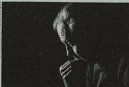
Depression und Autoimmunkrankheiten treten oft gemeinsam auf, doch der genetische Beleg für einen Zusammenhang fehlt.