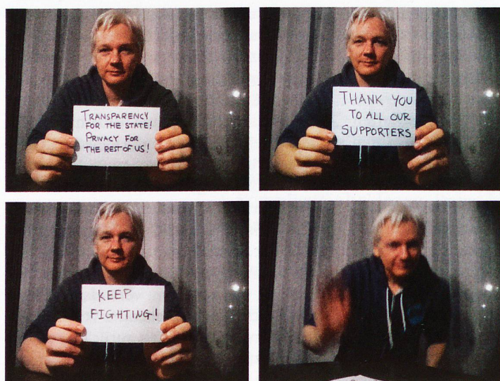
Aus einem Paket heraus filmte eine Kamera 32 Stunden lang den Weg durch die Verteiler der Post und landete schliesslich in der ecuadorianischen Botschaft von London. Tausende hatten die Reise auf Twitter verfolgt. Am Schluss des Experiments trat Julian Assange selbst vor die Kamera.