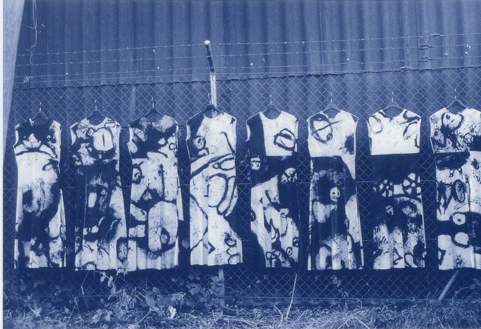
Getragene Kleider 98

8 Kleider BW Pigment Melkfett Kinderspuren