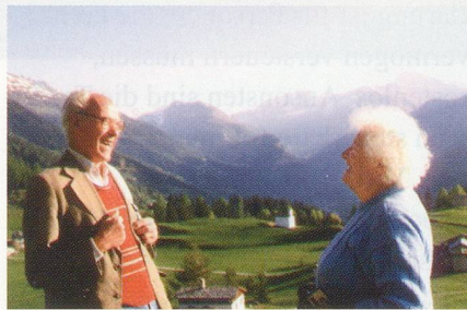
Ein Fünftel aller Teilnehmenden ist über 50 Jahre jung. Zwei Teilnehmende eines Bergwaldprojektes im Puschlav.