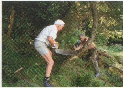
Die Teilnehmenden werden durch erfahrene Gruppenleiter angeleitet. Erstaunlich, was forstliche Laien alles können! Die Arbeiten werden von den lokalen Forstleuten als Qualitätsarbeit eingestuft.

Seit der Gründung des Projekts vor 16 Jahren haben über 11000 Personen an einer Projektwoche teilgenommen. In einer Woche leben rund 20 Leute gemeinsam in