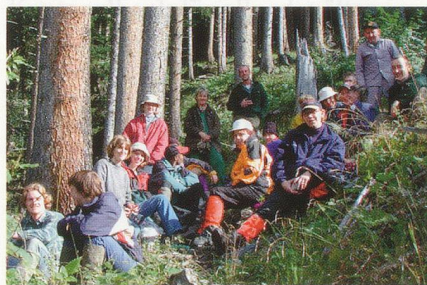
Die Gruppen sind immer bunt gemischt. Nicht die Leistung eines Einzelnen zählt, sondern was man gemeinsam erreicht!

unterschiedlichsten Unterkünften: Vom Zelt bis zum Zwei-Bett-Zimmer bietet das Bergwaldprojekt fast alles. Die Teilnahme ist kostenlos. Das Projekt finanziert sich zu einem grossen Teil durch Spenden und Mitgliederbeiträge.