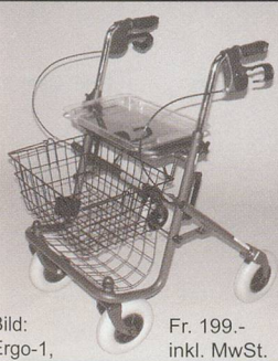
Bild: Ergo-1, Fr. 199.- inkl. MwSt.