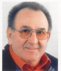
Arthur Stucki Raumpflege Telefon 041 727 50 50