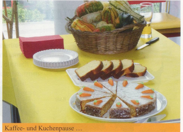
Kaffee- und Kuchenpause ...