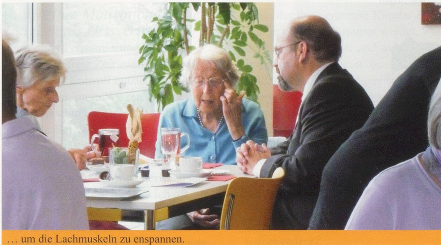
... um die Lachmuskeln zu entspannen.