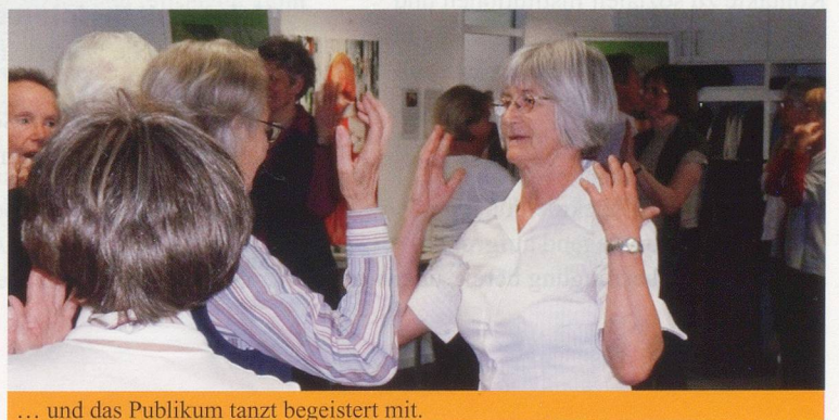
... und das Publikum tanzt begeistert mit.