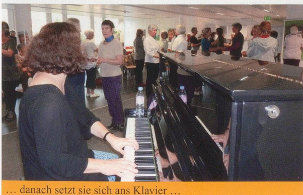
... danach setzt sie sich ans Klavier ...