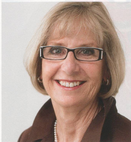
Bereichsleiterin Bewegung und Sport ab 1. Januar 2011