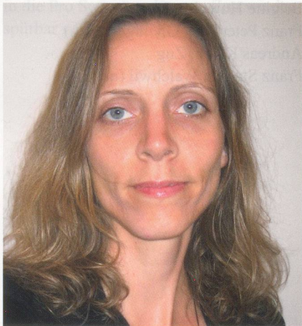
Mitarbeiterin Soziale Dienste ab 15. Juni 2011

Die Familienhilfe als solche kenne ich bereits, da ich seit Sommer 2010 selbst als Familienhelferin im Einsatz war. Dieses Wissen und die damit verbundenen wertvollen Erfahrungen werden mir in meinem neuen Job sehr hilfreich sein, damit ich mich für die Ziele der Organisation voll einsetzen kann. Auf die neue Herausforderung freue ich mich sehr.