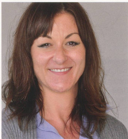
Bereichsleiterin Bildung und Kultur ab 1. April 2011

Bewegung ist für alle Menschen der Grundstein, gesund älter zu werden. Wenn Sie dies noch mit Freude in einer Gruppe Gleichgesinnter tun können, ist Bewegung sogar doppelt so schön und wirksam.