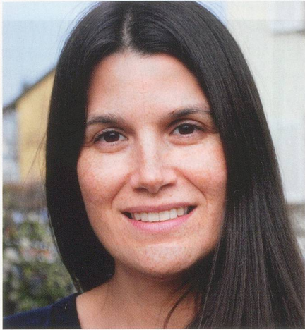
Mitarbeiterin Hilfen zu Hause ab 1. April 2011