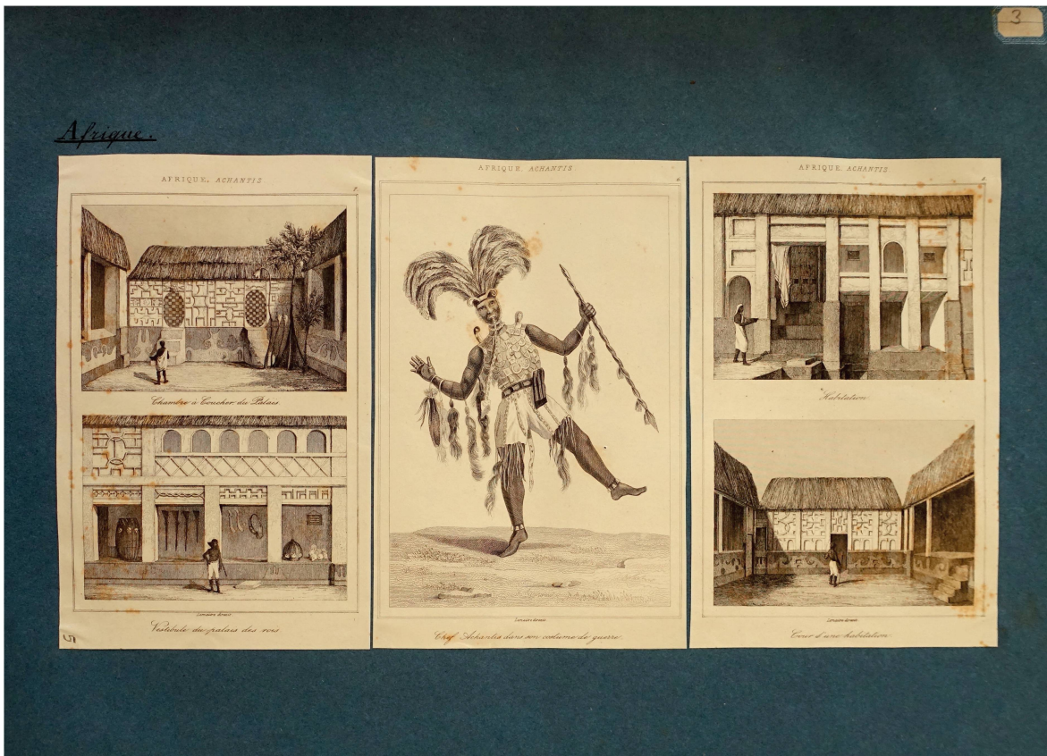
Fig. 5. Planche illustrant des architectures et costumes de l'Afrique Achantis tirées de M.F. Hofer, Afrique australe... tome 5 ( L'univers pittoresque ), gravures sur acier, dans Histoire de l'Ornement – Collection Hermann Hammann , tome 10, planche 5 © BAA.