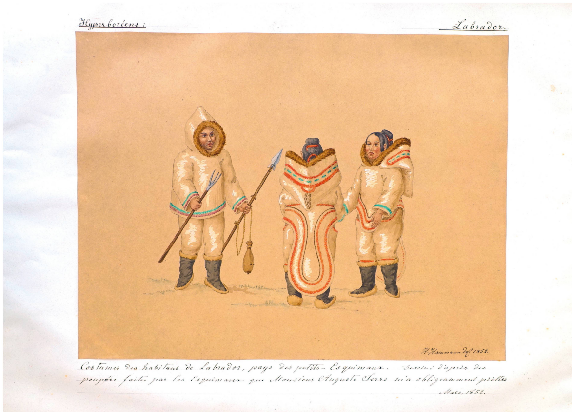
Fig. 3. Hermann Hammann, Costumes des habitants du Labrador, crayon, encre et aquarelle, 1852, dans Histoire de l'Ornement – Collection Hermann Hammann , tome 1.2, planche 12 © BAA.