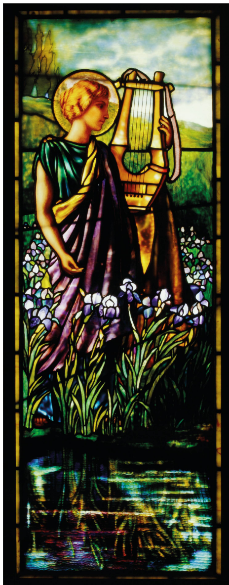
Abb. 3. Jakob Adolf Holzer, Heilige Caecilia , opaleszente Verglasung, 145 × 53 cm, um 1900, Vitromusée Romont, Depositum der Schweizerischen Eidgenossenschaft, Bern, fK11748.