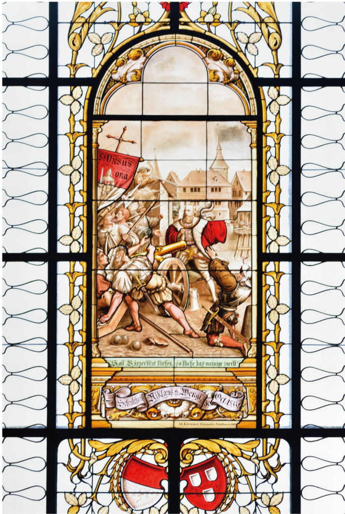
Abb. 11. Adolf Kreuzer, Schultheiss Wengi vor der Kanone , Bleiverglasung, Kunstmuseum Solothurn, 1902.

heiss die Besucherinnen und Besucher des zwischen 1897 und 1900 nach Plänen des Solothurner Stadtbaumeisters Edgar Schlatter (1857–1932) im Neorenaissance-Stil ausgeführten Kunstmuseums in einem monumentalen, an der Nordwand des zentralen Treppenaufgangs angebrachten Glasgemälde mit den Worten «Soll Bürgerblut fließen so fliesse das meinige zuerst!». Das Werk reiht sich stilistisch und technisch in das reiche Œuvre Kreuzers ein, der als einer der Hauptvertreter der historistischen Glasmalerei in der Schweiz gilt.