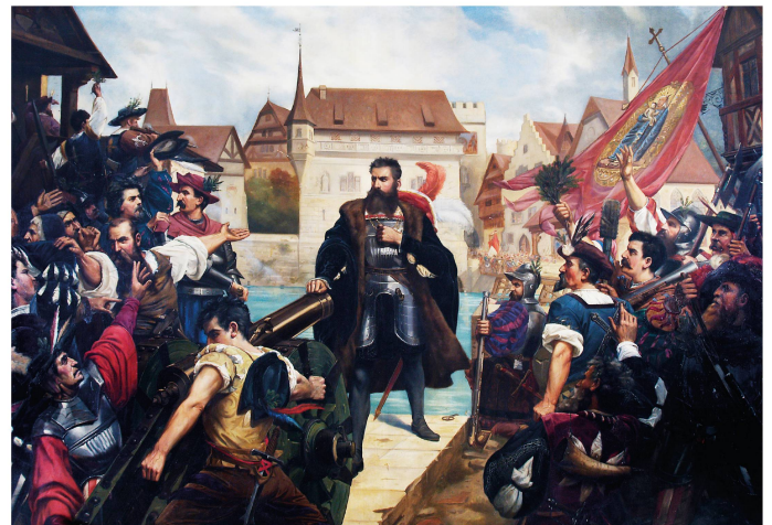
Abb. 10. Walther von Vigier, Niklaus Wengi vor der Kanone , 1884, Öl auf Leinwand, Museum Altes Zeughaus, Depositum des Kunstvereins Solothurn, Inv.-Nr. B I 2.

Die 1993 zusammen mit der Wengi-Apotheke an die gegenüberliegende Hauptbahnhofstrasse 7 versetzte, neunteilige Fensterverglasung, die sich seit 2001 im Vitromusée Romont befindet, zeichnet sich durch ein zentrales Bildfeld mit der Darstellung des Solothurner Schultheissen Niklaus von Wengi des Jüngeren (1485–1549) aus (Abb. 9), der durch seine ruhmreiche Tat im Zuge des Religionskonflikts zwischen Katholiken und Reformierten zu einem Volkshelden der Solothurner Geschichte wurde. 28 So stellte sich der überzeugte Katholik 1533 vor die Kanone seiner Konfessionsgenossen, um vor der Spitalkirche unnötiges Blutvergiessen auf der protestantischen Seite zu verhindern. Der trotz seiner streng katholischen Überzeugung zu einem Symbol der Toleranz gewordene Wengi sollte im 19. Jahrhundert zu einem beliebten Solothurner Bildthema werden, das in der Malerei und Druckgrafik jener Zeit gerne und oft dargestellt wurde (Abb. 10). 29