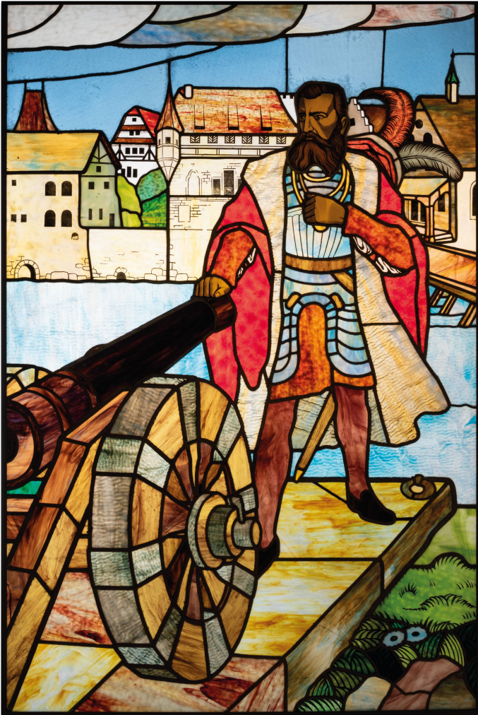
Abb. 9. Unbekannter Künstler, Schultheiss Wengi vor der Kanone , Bleiverglasung, um 1909, Vitromusée Romont, VMR 462, Dauerleihgabe Museum Blumenstein, Solothurn.