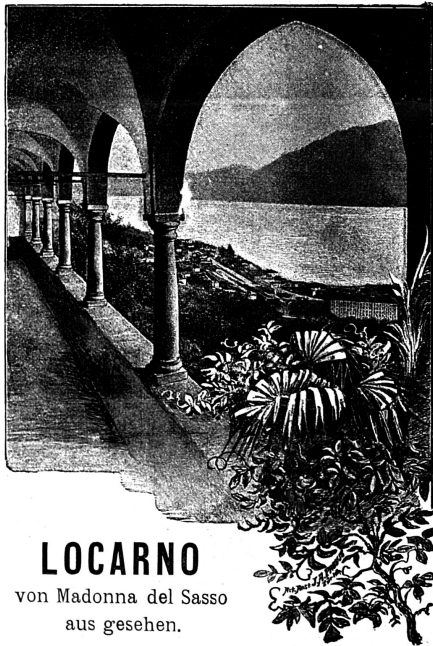
LOCARNO von Madonna del Sasso aus gesehen.

Klingt es nicht wie Hohn, wenn man unter der Abbildung rechts liest: „Locarno von Madonna del Sasso aus gesehen.“ Sollte es nicht eher heissen: „Locarno bei Nacht?“ Nein; denn auch diese Bezeichnung klinge noch höhnisch, weil Locarno sogar bei Nacht schöner ist, als Figura zeigt. Kaum dass man die Säulen des Wandelganges des Minoritenklosters Madonna del Sasso auf der Zeichnung unterscheidet, abgesehen davon, dass das Cliché allein einen Raum von ca. 80 Petitzeilen à 20—25 Ct. die Zeile umfasst. Unsere inserierenden Leser mögen diese Auseinander-