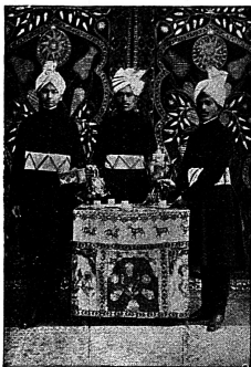
Gaerçons indiens au Tea-room, Berlin.

ist die einzige Firma der Neusilberwarenbranche (versilberte Bestecke und Tafelservice aus Weismetall, Nickellegierung) die eine Fabrik in der Schweiz besitzt. Sie ist daher in der Lage, Waren erster Qualität zu vorteilhaften Preisen zu liefern und irgendwelche Reparaturen und Wiederversilberung sachgemäss in kürzester Frist auszuführen.