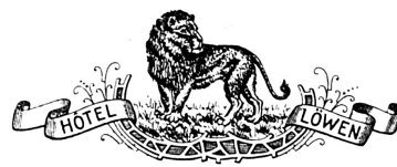
Hotel Löwen (mit Schlaufe) Altes Muster