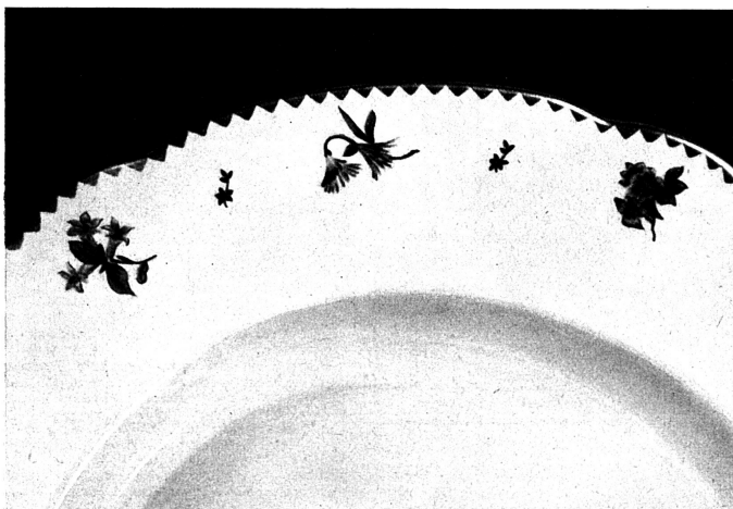
Dieses Dekor des Hotels Berghaus (mit Mattgoldzackenrand und Naturgetreu reproduzierten Alpenblumen) trägt echt schweizerischen Charakter und zeugt von gut angepasster Individualität

Es besteht heute das Bestreben, die Teller immer flacher zu erhalten. Diese Forderung greift nicht unwesentlich in die Gesteigungskosten hinüber. Denn beim Garbrand des Porzellans erweicht nicht nur die Glasur, sondern auch der Scherben. Infolgedessen senkt sich der Rand des Tellers, somit muss er bei der ersten Formung steiler gestaltet werden. Je mehr man aber den endgültigen Rand wagrecht haben will, desto mehr senkt er sich beim Brennen, da