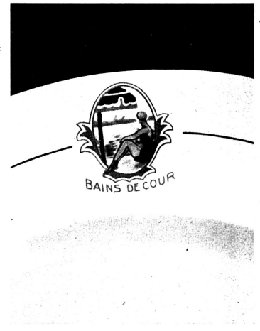
Dreifarbige (rot, blau u. gelb), sehr wirkungsvolle Vignette der neuesten Langenthaler Porzellanfabrikation

Individualität der Form und des Dekors im Porzellangeschirr, sind zwei Momente, durch welche der heutige Gaststättenbetrieb recht vorteilhaft auf seine Gäste wirken kann. Dass die einzige schwei-