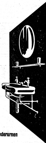
Glanz-Eternit A.G. Niederurnen

verwendet wird. Höchste Hygiene, da abwaschbar. Niedriger Preis. Auf jeder Unterlage montierbar. — Muster, Prospekt und Kostenvorschläge durch