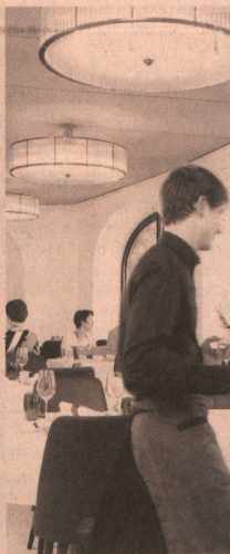
BETRIEBE DER HOTELBUSINESS ZUG AG