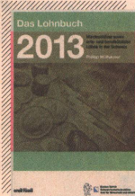
«Das Lohnbuch 2013»

Über den Lohn sprechen viele nicht gern. Umso interessanter ist ein Buch, aus dem man mehr über die Löhne der anderen erfährt. Selbstverständlich steht nicht darin, wie viel Herr Meier im «Sternen» verdient, sondern es sind die Mindest- sowie orts- und berufsüblichen Löhne in der Schweiz festgehalten. Für das Gastgewerbe kennen wir die Mindestlöhne aus dem L-GAV. Spannender ist also zu erfahren, wie hoch die (Mindest-)Löhne in anderen Branchen sind. Dabei zeigt sich, dass die Löhne im Detailhandel oft tiefer liegen als jene in der Gastrobranche. So verdient beispielsweise eine Detailhandelsfachfrau oder ein Detailhandelsfachmann (dreijährige Lehre) in einer Bäckerei-Konditorei nur gerade 3.553 Franken. Im Gastgewerbe sind es mit einer dreijährigen Lehre immerhin 4.100 Franken. Wo wird dann das grosse Geld verdient? Natürlich bei den Banken, denkt man. Doch ein Kreditoren- und Debitorenbuchhalter beginnt auch nur mit 4.583 Franken. Bis ein Lohn 10.000 Franken übersteigt, muss man beispielsweise Finance Manager mit sechs bis neun Berufsjahren sein.