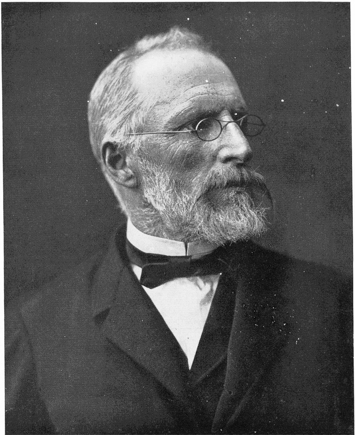
Tafel 2 Johann Jakob von Tschudi