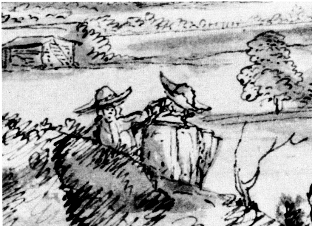
10 Ausschnitt aus Abb. 11: Die beiden Wanderer.