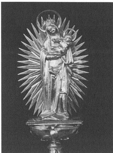
Madonna aus der Monstranz

– Die Achtung der Frau, der Natur, ihrer Masse und Gesetze soll im alltäglichen Leben bestimmend wirken. Göttliche und menschliche Gerechtigkeit sind unterschieden, stehen aber in Beziehung zueinander.