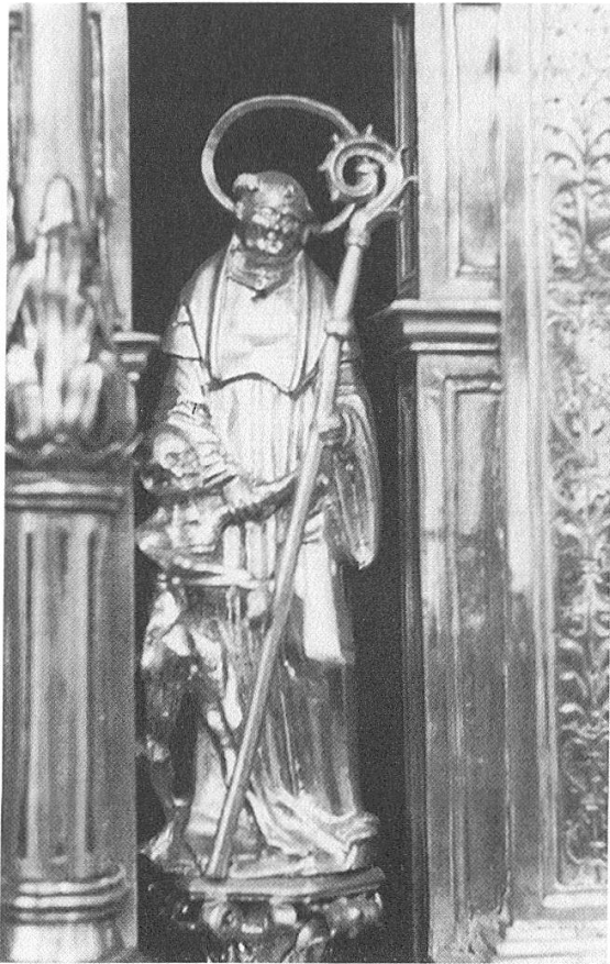
St. Fridolin mit Ursus in der Monstranz