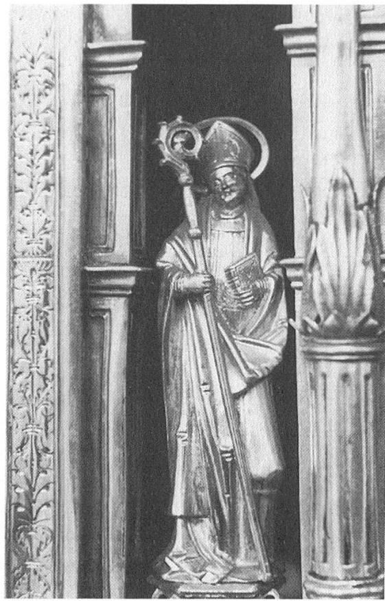
St. Hilarius. Gegenfigur zu St. Fridolin

halten sie im Nodus die vier Welten zusammen. Auch Engel sind gemeinsam stark. Sie stellen aber Gott ins Zentrum, nicht das Individuum. Sie zeigen, wer Krisen überwindet, wer Energien gibt, Persönlichkeit stärkt. Engel sind schon bei Sumerern, später Babyloniern, Ägyptern, bei Juden, Mohamedanern und den Christen als göttliche Boten wirksam. Diesen Engeln ist aber eine Doppeldeutung anzumerken. Erstmals ist hier auf einer Monstranz eine negative Kraft zu spüren, ganz unauffällig am Rande angesiedelt. Beginnend beim schwankenden Element, der Blumen-Girlande, die von zwei verschmitzt lachenden Knaben gehalten wird. Darunter toben wütend aufgewundene Drachen, gespickt mit Haken und Spitzen. Die aufgerissenen Mäuler zeigen furchterregende Zähne, von denen giftige Bosheit in die Wasserspeier spritzen. Über die Brunnensäulen rinnt der Unrat, von unbekümmerten Kindern mit blossen Füßen getreten, auf das schräge Gebälk. Darauf sitzen wieder zwei Putten, mit Pauken und Trompeten, Geschlechtskrankheiten antönend. Könnten die zwei Lichtengel auf den Säulen zugleich Kriegsflaggen schwingen und den Stab als Waffe gebrauchen, wo sie eher als Schutzengel anzusehen sind? Unter dem Hauptgeschoss lauern zwei geknebelte Drachen mit schrecklichen Gesichtern, je von einer Engelgruppe im Zaum gehalten. Den Nodus umzüngeln Flammen und unter dem Achteck-