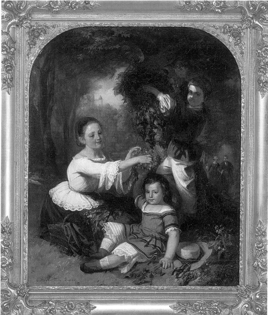
Familie von der Mühl. Ölgemälde des Basler Historienmalers Ernst Stückelberg (1831–1903), von 1856. (Privatbesitz)