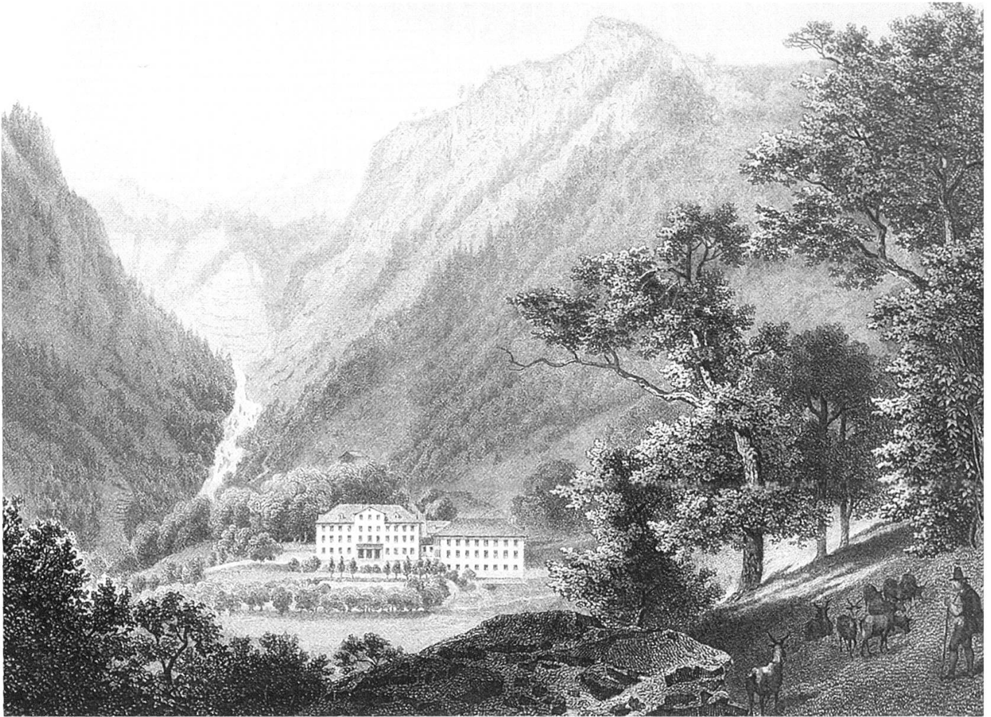
Bad Stachelberg. Stahlstich von A. Fesca, nach einer Zeichnung von Ludwig Rohbock, 1865. (LaGI)