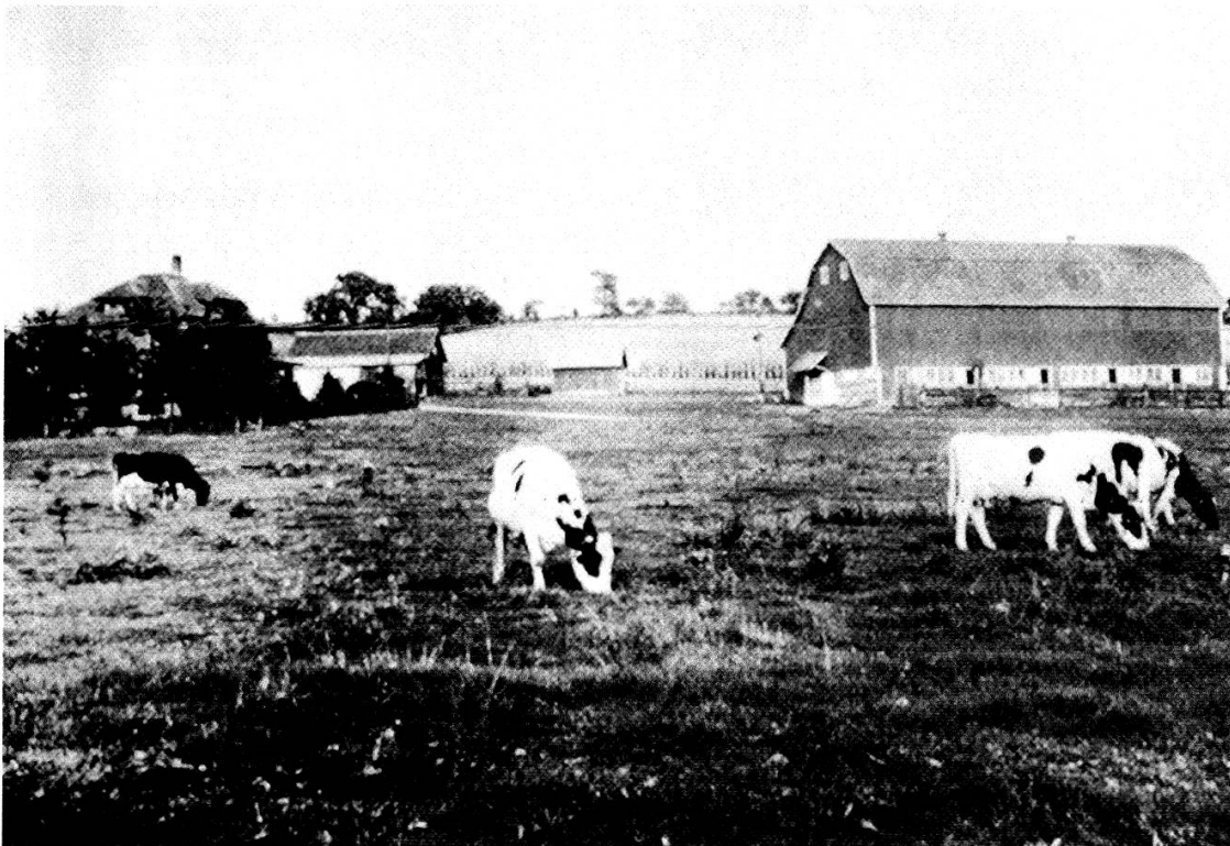
Die Kubly- oder Tell-Farm in New Glarus. Um 1940. (aus Herbert Kublys «At Large»)