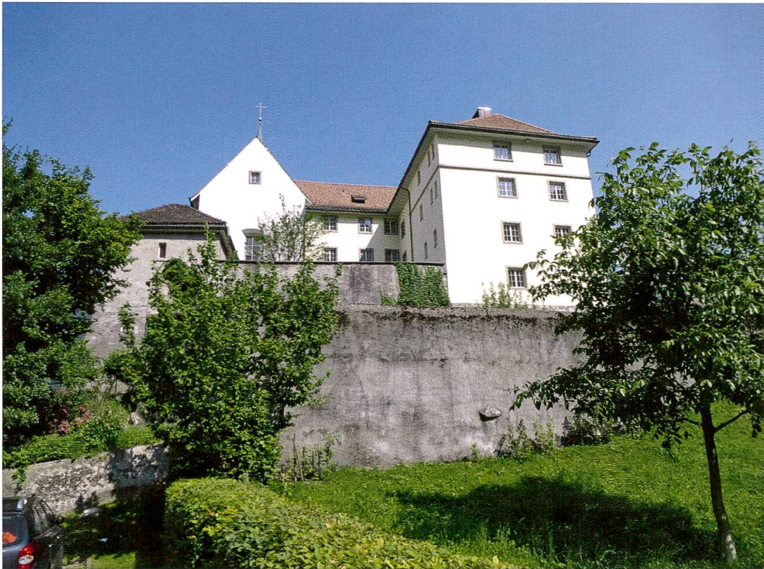
Das 1675 bis 1679 errichtete ehemalige Kapuziner- und heutige Franziskanerkloster Mariaburg in Näfels von Westen.