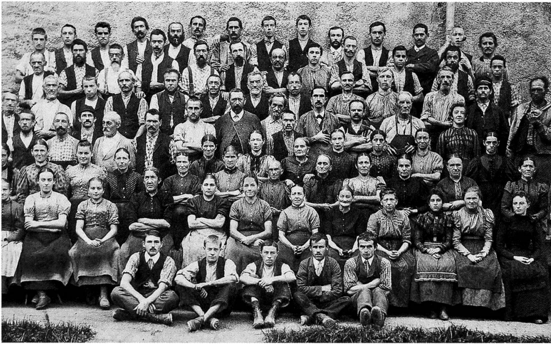
Arbeiterinnen und Arbeiter der Textildruckerei Trümpy, Schaeppi & Cie um 1900. Solche Aufnahmen sind ebenso selten wie Forschungen zu den Lebensbedingungen der Glarner Fabrikarbeitschaft.

Joris zeigt, dass dieser Weg nach wie vor erhellende Einblicke in die Vergangenheit bieten kann. In diesem Sinn hätte der Unternehmer und Politiker Eduard Blumer schon lange eine ausführliche Würdigung verdient. Als langjähriger Landammann ab 1887 übte er einen prägenden Einfluss auf das politische Geschehen im Glarnerland aus.