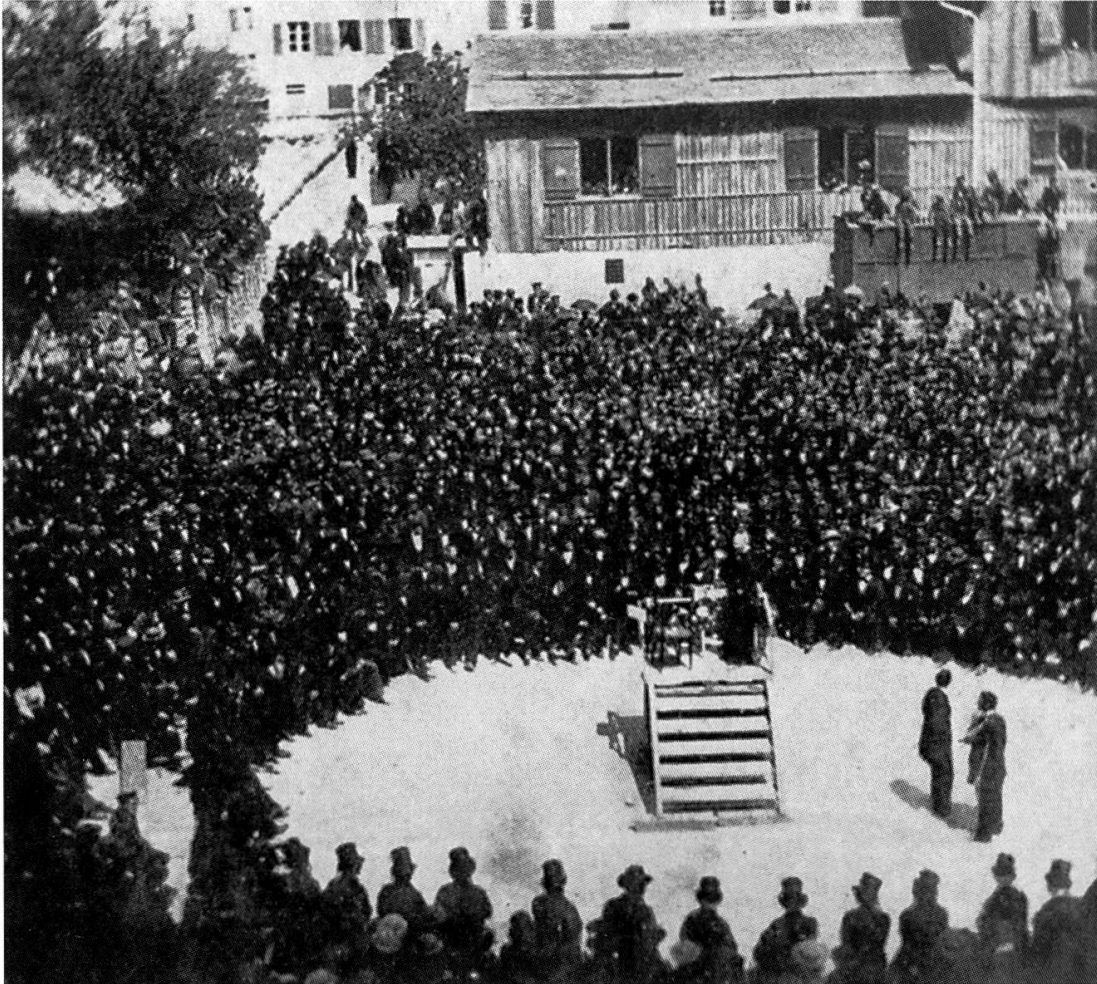
Die Landsgemeinde in einer verschollenen Aufnahme von 1861. Sie fällt schon im 19. Jahrhundert überraschende Entscheide, allerdings nicht immer auf demokratisch einwandfreie Art.

verhielt sich die Mehrheit der Bevölkerung, die in der Mitte des Jahrhunderts noch nicht zur Fabrikarbeiterschaft zählte? Wie ist die Tatsache einzuschätzen, dass die Landsgemeinden von 1864 und 1872 tumultuös und undemokratisch verliefen? Warum warfen die drei ersten Fabrikinspektoren nach Ablauf der Amtszeit alle das Handtuch?