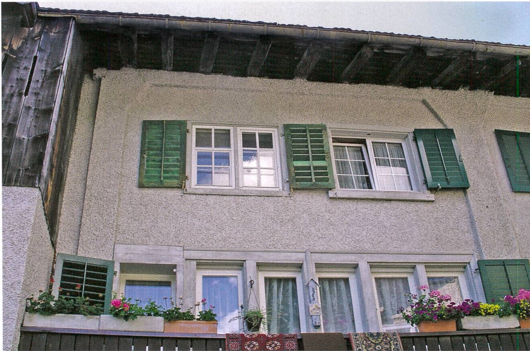
Ständer-Bohlen-Konstruktion des 15./16. Jahrhunderts in Ennetbühl. Das Wandgerüst aus senkrechten Ständern reicht über zwei Geschosse und zeichnet sich in der verputzten Fläche ab. Die dreieckartigen Kopfstreben der Ständer sind sog. angeblattet.

Im Laufe des 18. Jahrhunderts gewann die Textilindustrie an Bedeutung. Zuerst wurde die Produktion in den Wohnhäusern der Familien untergebracht, die sich dadurch zusätzliche Einkommen erwirtschafteten. Damit wurden Wohnbauten in den wachsenden Dörfern zu gewerblichen Zwecken umgenutzt – und später wieder der Wohnfunktion zugewiesen. Deshalb ist diese Etappe der Wirtschaftsgeschichte mit Verlagswesen und Manufakturen heute kaum mehr sichtbar. Auch eine klare Einteilung der Bauten nach ihrer Funktion wird dadurch schwierig; man spricht deshalb von Bauaufgabe und sekundären Nutzungen.