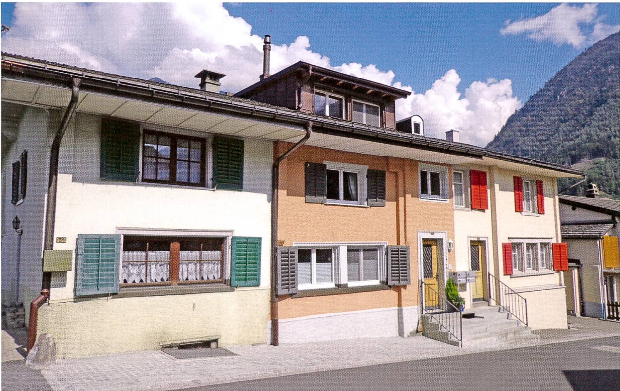
Verdichtete Zeilenbauweise des 15. bis 18. Jahrhunderts in Schwanden Oberdorf. Die trauforientierten Fassaden unter flach geneigtem Pfettendach (Tätschdach) sind nach Süden ausgerichtet, mehrere Bauphasen zu einer Flucht vereinigt. Die Blockvorstösse definieren die einzelnen Haus- teile. Die Vorstösse wurden teilweise abgesägt und sind heute verputzt.