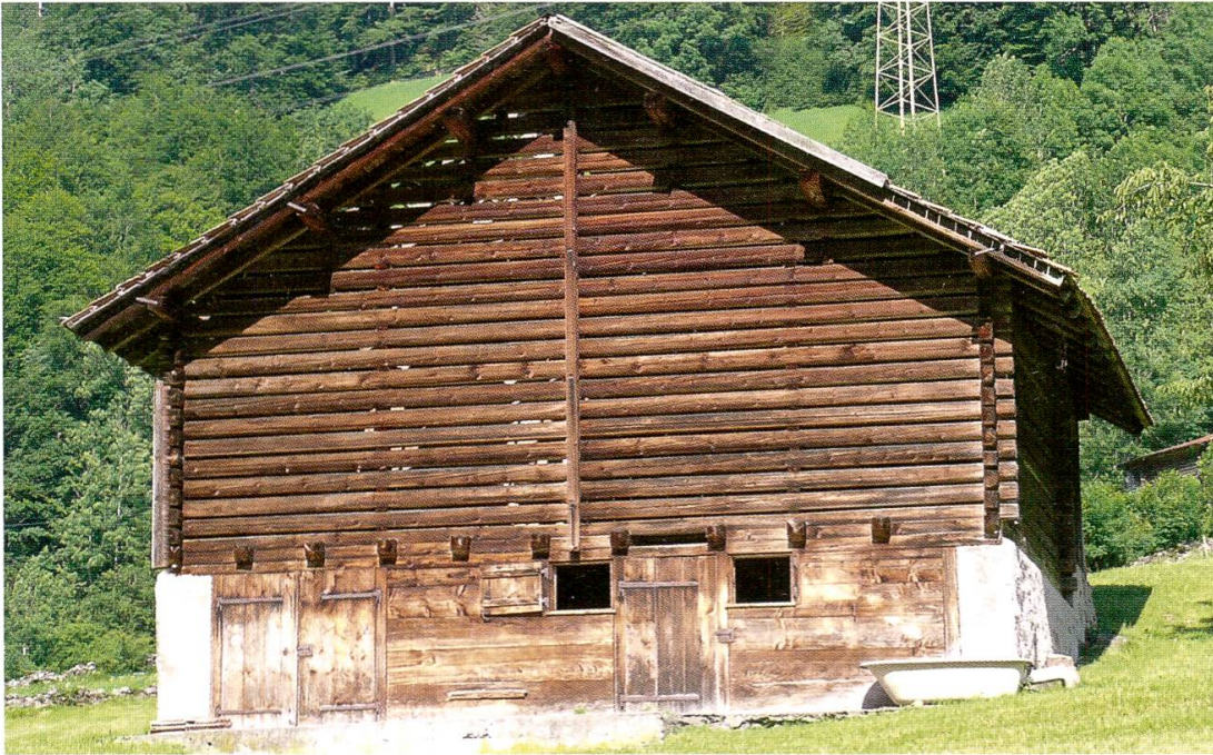
Stallscheune (Gaden) mit maschinell zugerichteten Kanthölzern in Hätzingen, Ende 19./ Beginn 20. Jahrhundert. Typologische Vielfalt, landschaftsprägende Präsenz und sozialhistorische Bedeutung machen Gäden zu wichtigen Inventarobjekten im Sinne der Gesetzgebung.

Daneben stehen auch die Bauten in Berg- und Alpzone im Fokus. Die Erarbeitung gab Gelegenheit, dreissig Jahre nach der letzten Untersuchung durch Jost Hösli, Entstehung und Wachstum der Siedlungen zu verfolgen und dabei die soziale und wirtschaftliche Entwicklung der Gemeinschaften im Tal zu dokumentieren. Bestehenden Desiderata der Glarner Geschichte wurde dabei Rechnung getragen.