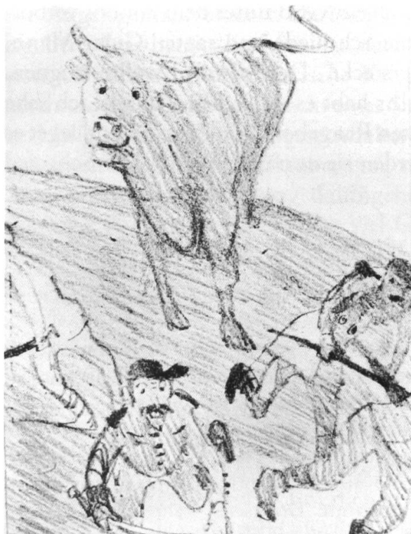
Der Geisterjodler, Zeichnung von Kurt Mühlbauer. In: Glarner Sagen, S. 80.

Teuflisches oder zumindest Übersinnliches ist im mehrheitlich protestantischen Glarus – im Gegensatz zu den umliegenden katholischen Orten wie Uri, Schwyz oder dem Sarganserland 12 – wenig auszumachen. Nur gerade