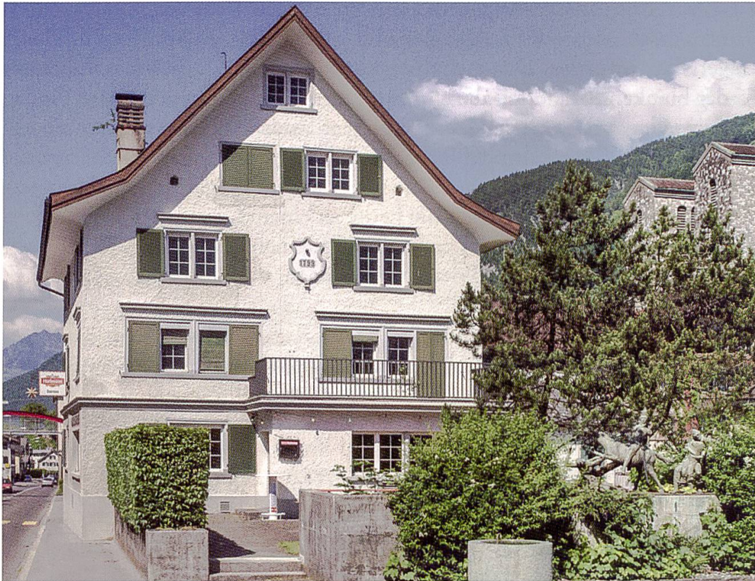
Frontseite des Gasthauses Sternen an der Landstrasse in Netstal. Gut sichtbar die eingemauerte Kanonenkugel aus den Gefechten von 1799.

haben, wie er bei der steinernen Brücke plötzlich aus dem Dickicht hervorgekommen und durch die Strassen bis oben, wo die Schlucht wieder enger zu werden beginnt, gewandelt und dann im Gebüsch verschwunden ist. Sie erklären diese Erscheinung so: Zur Franzosenzeit verirrte sich ein französischer Soldat ins Wägital. Hungrig und erschöpft kam er im Röthentäli an, wo er einen Bauern traf, der ihn für einen feindlichen Spion hielt und deshalb niedermachen wollte. Der Franzose versuchte dem Bauern, so gut er konnte, verständlich zu machen, dass er kein Feind sei. Er bat ihn um Speise und zeigte ihm zur Bekräftigung und zum Zeichen, dass er ein guter Katholik sei, den Rosenkranz, den er als frommer Soldat stets auf sich trug. Dessen ungeachtet, drang der rohe Bauer auf den armen Mann ein, der vor Hunger und Anstrengung kaum mehr stehen konnte, und tötete ihn. Das Gewissen liess ihm aber keine Ruhe. Seine gemeine Tat wurde bekannt. Er wurde festgenommen und hingerichtet. Zur Strafe muss er jetzt wandeln.» 28