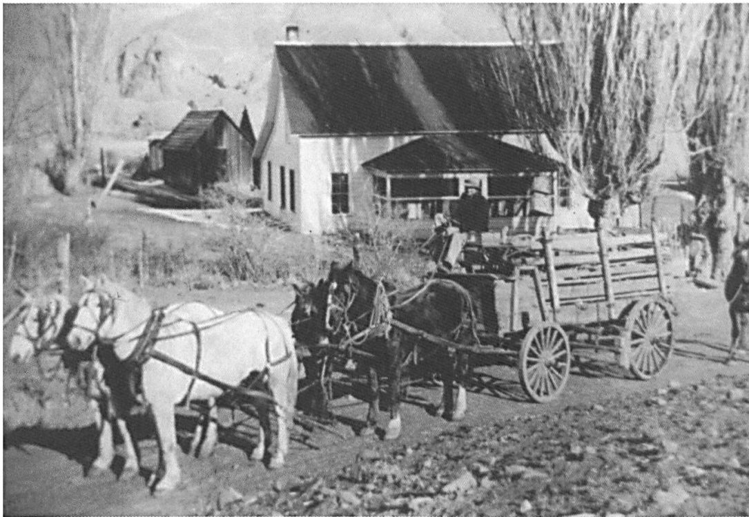
Die Käser Ranch am Cherry Creek in Oregon. (aus: Oregon Historical Quarterly 3, 1980, S. 311)