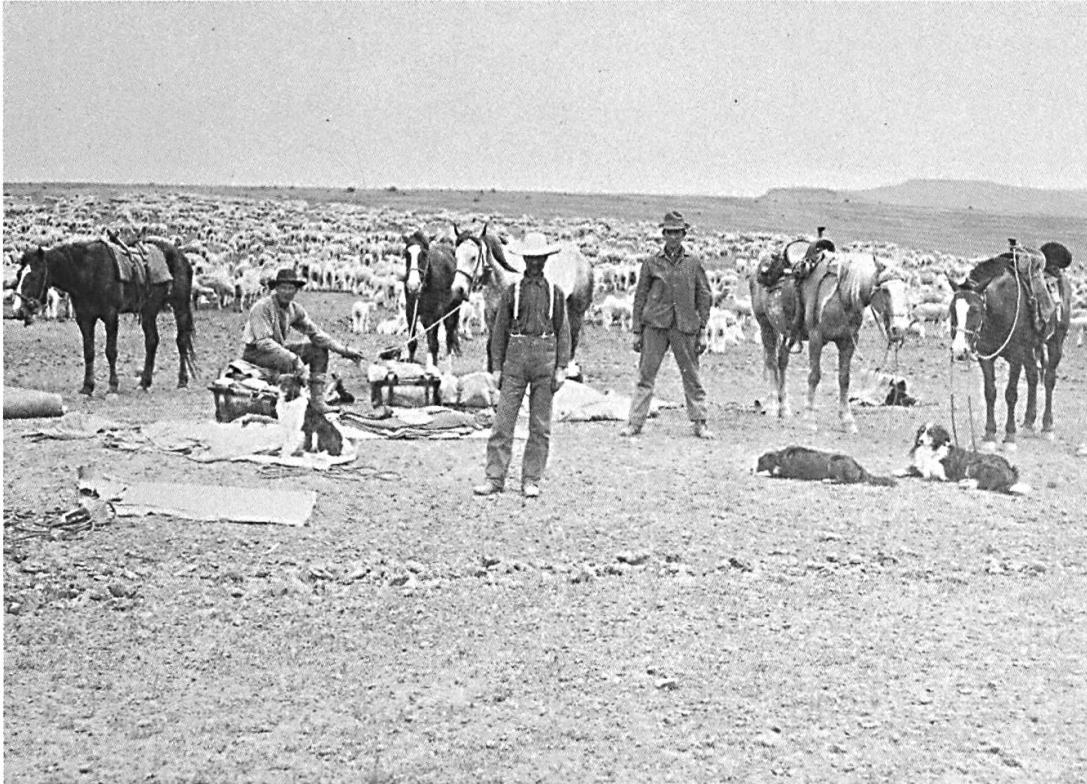
Die Schafhirten Oregons waren im ausgehenden 19. Jahrhundert häufig zu Pferd unterwegs. Aufnahme um 1880.