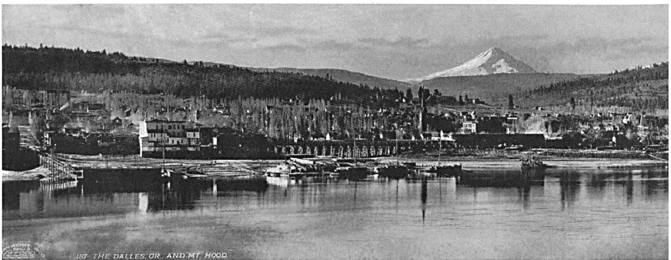
The Dalles am Columbia River, Warenumsschlagplatz und Sitz von Banken und Notariaten. Im Hintergrund Mt. Hood, eines der Wahrzeichen Oregons. Undatierte Aufnahme. (aus: Jahrbuch des Oberaargaus 39, 1996, S. 153)

Ich blieb für zwei Jahre bei der Eisenbahn und wurde mit der Zeit Bremser; aber ich wollte Besitz und mein eigenes Geschäft haben. Ich wusste, dass ich nie eine Eisenbahn zu eigen haben würde und begann mehr und mehr den Rat meines irischen Freundes zu überdenken. Anfang 1893 nahm ich mein Ersparnis von $ 825 und begab mich nach The Dalles in Oregon.