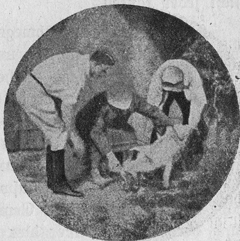
Das störrische Schwein.