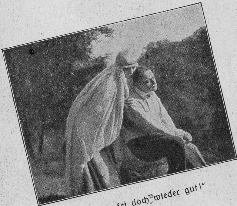
„Papa, sei doch wieder gut!“