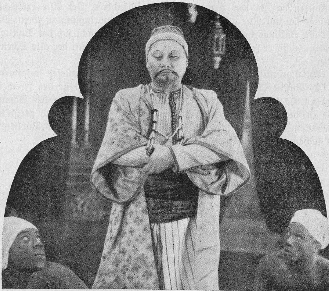
Paul Wegener als „Der alte Scheich“ in „Sumurun“.

Viele Gänge, viele Gemächer durchheilt er, immer vorsichtig, jeden Augenblick gewärtig, gefaßt zu werden. Da endlich erblickt er den jungen Scheich, der im Hofe des Harems gespannt ein erleuchtetes Fenster beobachtet. Die Tänzerin erscheint am Fenster und winkt ihn herauf. — —