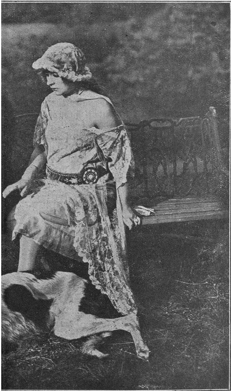
Szenenbild aus Tobias Buntschuh

bleiben, es gibt ja ganz einfache Schlüssel zur Berechnung, nur muß beim Leben Obacht gegeben werden.