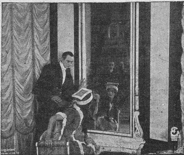
Szenenbilder aus dem Eichbergfilm „Die Macht des Blutes“. – Vertrieb: Bayerische Filmgesellschaft, Zürich.