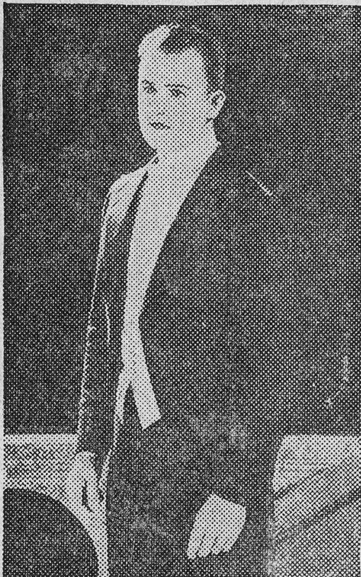
Reginald Denny in "THE LEATHER PUSHERS" UNIVERSAL JEWEL COLLIERS SERIES

Meine Zuversicht war um etliche Grade gesunken. Aber manchmal geschehen ja Wunder!