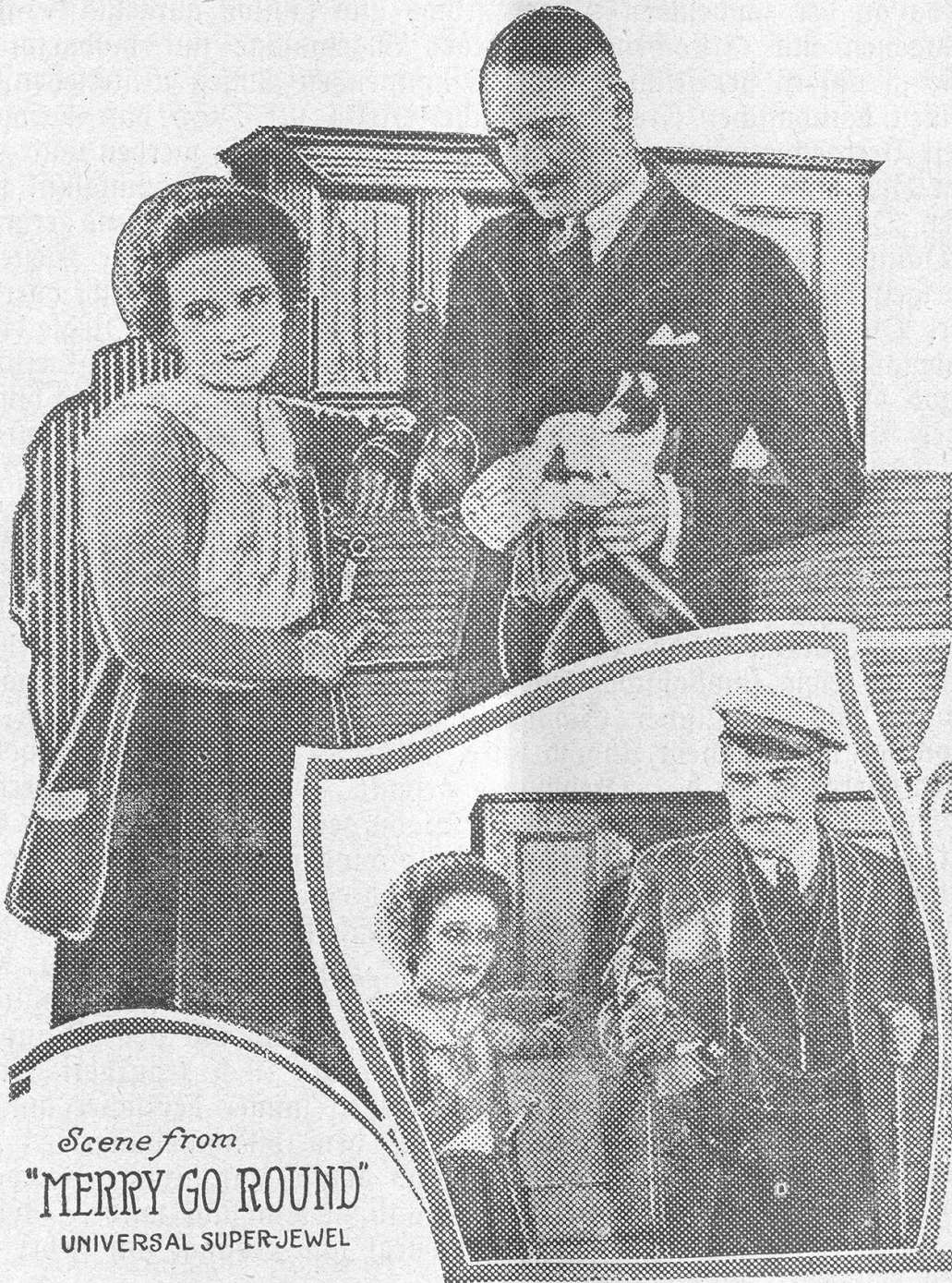
Scene from "MERRY GO ROUND" UNIVERSAL SUPER-JEWEL

Nur ein Allgewaltiger bemeistert sie, die blonden, roten, schwarzen Vampire. Wie vor Jahrhunderten ein Gehörnter auf dem böckstinkenden Bocksberg in der Walpurgisnacht die zaubergesalbten weiblichen Hexenleiber. Dieser moderne Hexenmeister heißt — — Zensur. Hockt in einem imperialistischen Lehnstuhl, dickwanstig, wohlgenährt, schwerblütig; ein kirchlich-staatliches Doppelgesicht, priesterlich-königlich, mit baumelndem Duderzopf. Und