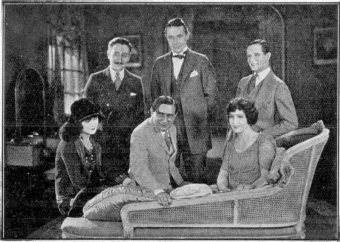
Ernst Lubitsch und die Hauptdarsteller von « Die Ehe im Kreise » im Warner Brother-Studio in Hollywood.

In der vorderen Reihe: Mary Prevost, Ernst Lubitsch, Florence Vidor; in der hinteren Reihe: Adolphe Menjou, Monte Blue und Creighton Hale.