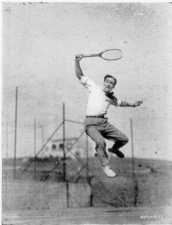
Norma Shearer und Charles Ray sind leidenschaftliche Tennisspieler.