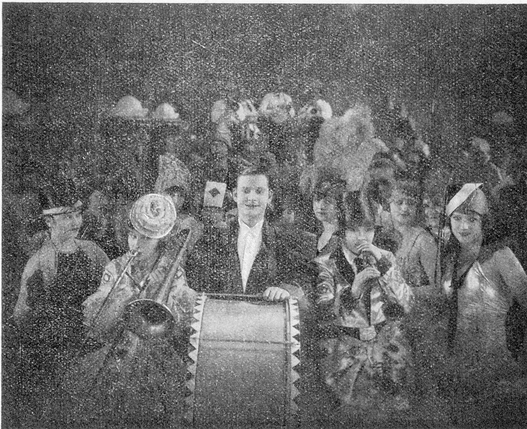
Natürlich spielt die moderne Jugend heute nicht mehr Klavier, sondern Jazzband!! Szene aus „Prinzessin Trulala“, mit Lillian Harvey in der Hauptrolle.