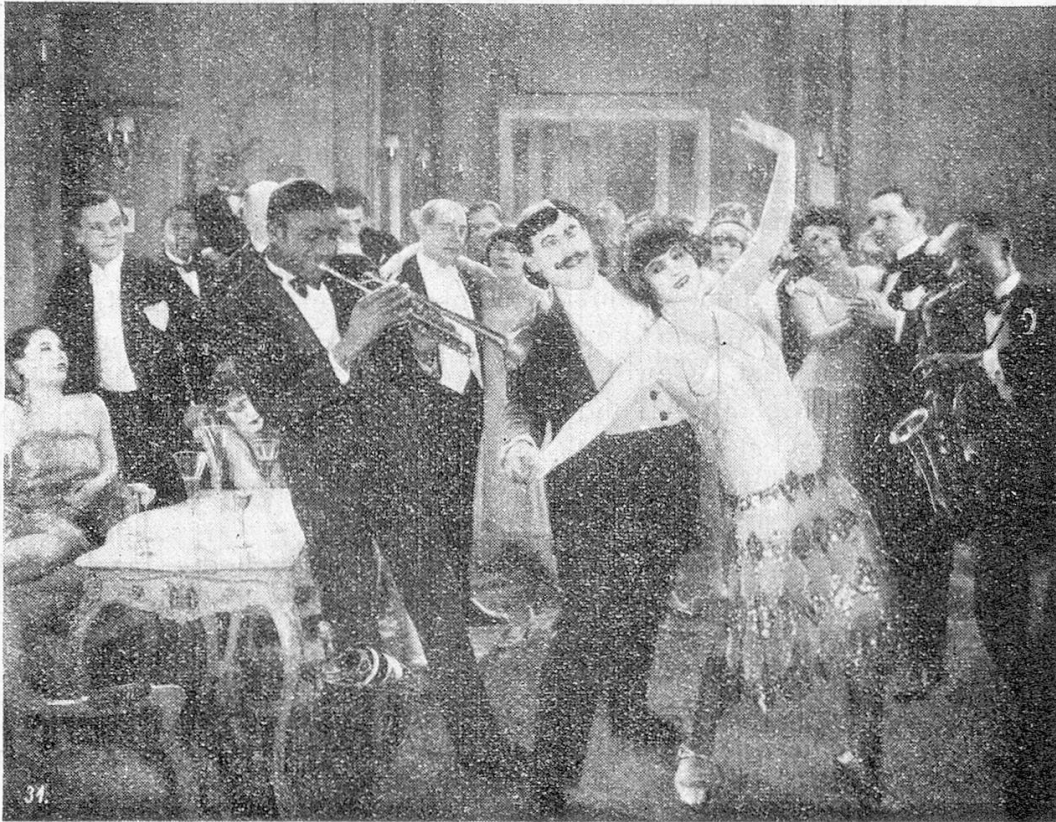
Eine Jazzbandszene aus dem Film „Der Prinz und die Tänzerin“