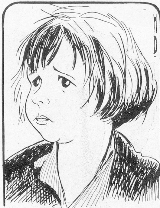
Auch der jüngste Filmstar ist nicht gegen Karikaturen gefeit: JACKIE COOGAN

Unzählig sind die Karikaturen, die sich mit der Filmwelt und ihre hauptsächlichsten Repräsentanten, dem Filmstar, befassen. Wir geben heute eine kleine Auslese, die in treffender Weise das Charakteristischste jeden Künstlers wiedergibt.