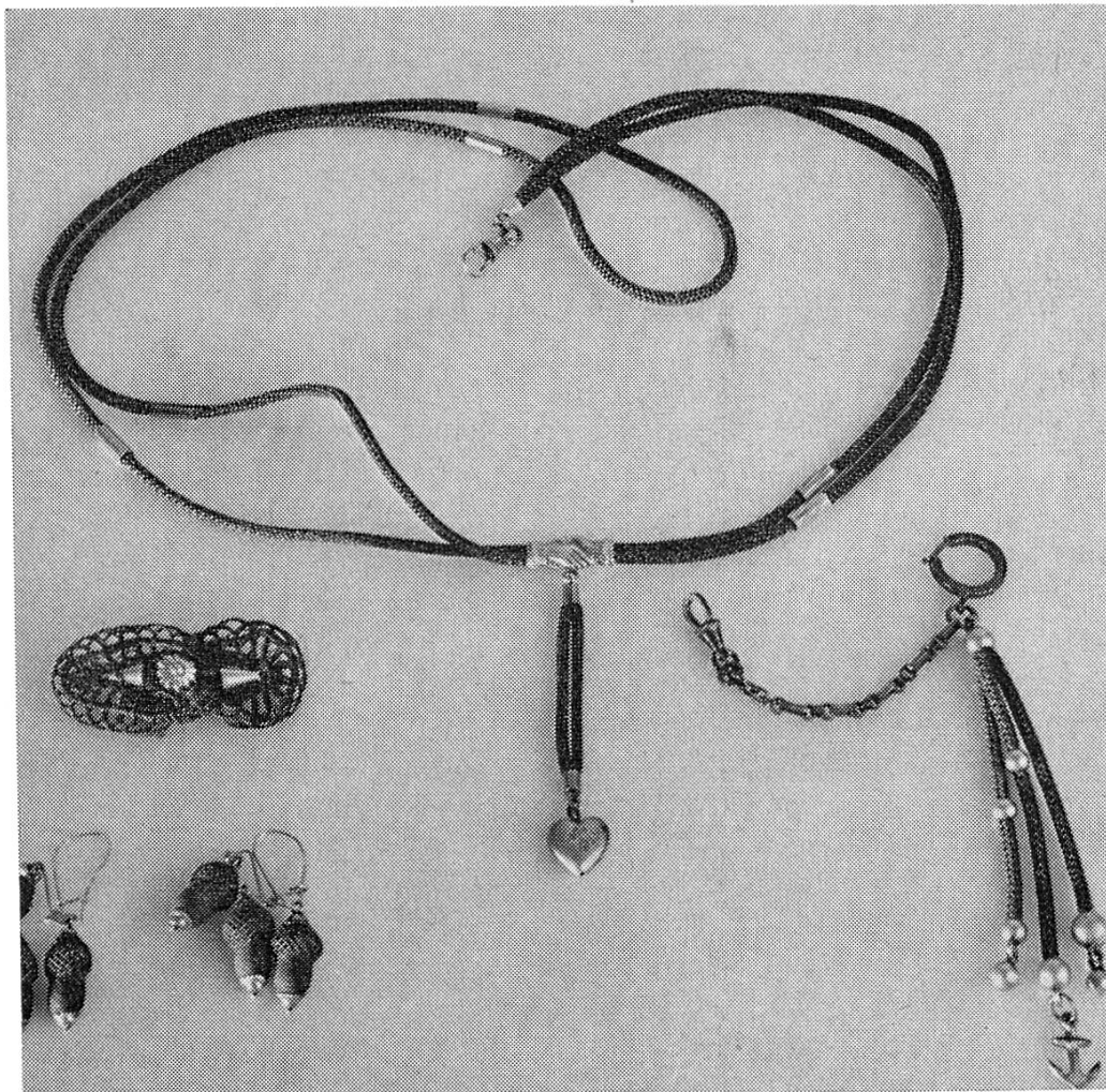
Abb. 4 Damenhaarschmuck: Halskette, Ansteckbrotsche, Anhänger und Haarbandglocken (Details siehe im Text).

wurde die Haararbeit während des Tröcknevorganges mit Papier unterlegt. Durch diese Gesamtbehandlung erzielte man die Wirkung einer Dauerwelle 6) .