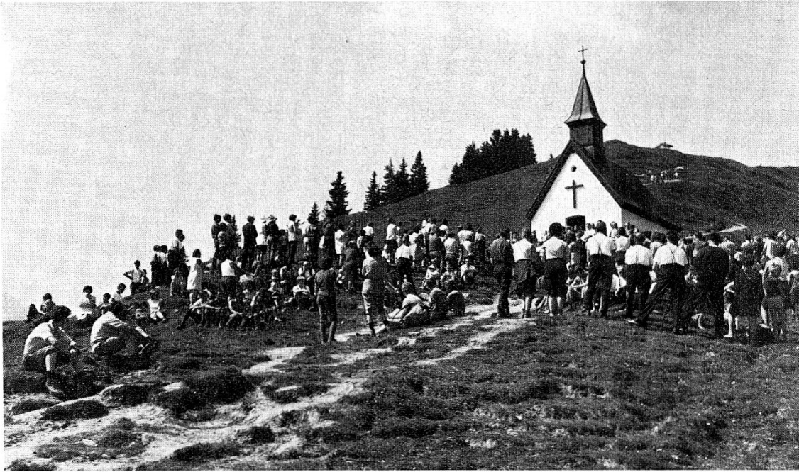
Berggottesdienst zu St. Jakob auf dem Kronberg

Beliebt sind besonders die Bergkapellfeste von Plattenbödeli (Sonntag nach Maria Heimsuchung, 2. Juli), Wildkirchli (Schutzengelfest am 2. Sonntag im Juli), Kronberg (Sonntag nach St. Jakob, 25. Juli), Megglisalp (Maria zum Schnee, 5. August), Ahorn (Maria Geburt, 8. Sept.) und Seealp (Bruder Klaus, 25. Sept.), sowie die Zweitpatrozinien auf dem Kronberg (Sonntag nach St. Bartholomäus, 24. August) und im Wildkirchli (Sonntag nach St. Michael, 29. Sept.). Nach dem feierlichen Gottesdienst finden sich die Sennen und die Gläubigen aus dem Tal in einer naheliegenden Bergwirtschaft zu einem Trunk oder Imbiß zusammen, wo die Festfreude nicht selten noch in Gesang, Musik und Tanz einen passenden Ausdruck findet.