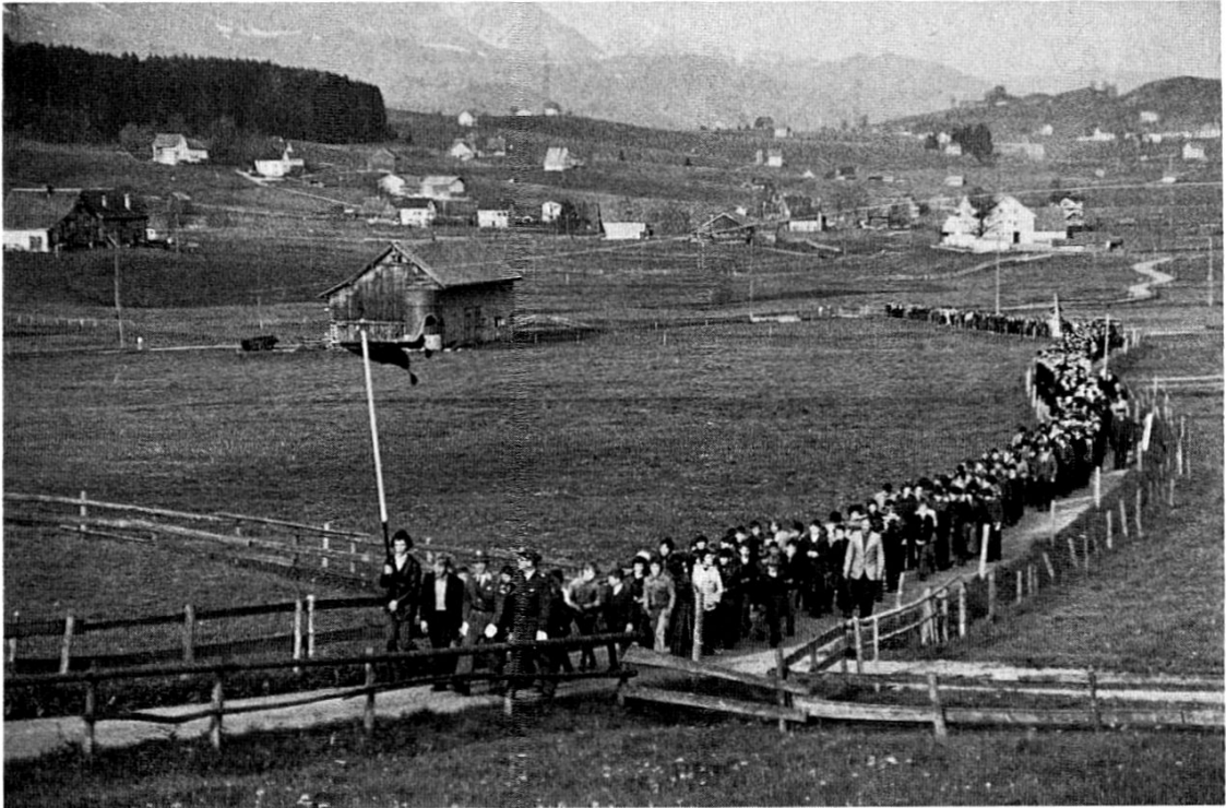
Die Teilnehmer an der Stossfahrt ziehen betend über die Möser nach dem Stoss

des Tages nicht durch eine »Modeschau« verdeckt wird. Familiäre Feiern mit einer wachsenden Zahl von Geschenken zu diesem Tag machen es den Kindern schon schwer genug, sich auf die Begegnung mit dem eucharistischen Herrn zu konzentrieren.