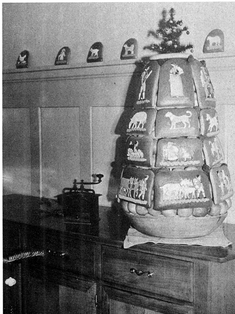
Der ›Chlausezüüg‹, die Lebkuchen- pyramide aus Eierringen, Chlauseäpfeln, Biberfladen und ›Chlausebickli‹

Nicht nur die Stube, sondern das ganze Haus ist an diesem Abend von Weihrauchduft erfüllt. Denn am späten Nachmittag wird in den Häusern ›g'räuchled‹. Im Dorf gehen die Ministranten mit Rauchfaß und ›Schiffli‹ von Haus zu Haus, und auf dem Land geht der Hausvater mit der qualmenden ›Räuchlipfanne‹ durch alle Räume des Hauses, durch den Stall und um Haus und Gaden herum, während die Familie – wenigstens früher! – in der Stube um Schutz vor allem ›Oebel ond Oofall‹ betet. Die ursprünglich wohl heidnische