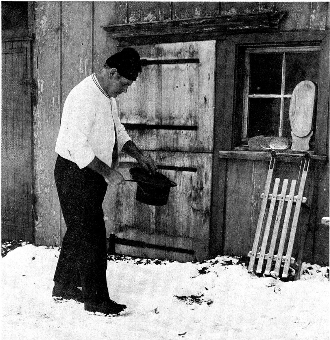
Der Familienvater mit der ›Räuchlipfanne‹ auf seinem Gang um Haus und Stall

Auch das Neujahrsingen in diesen Tagen gibt Gelegenheit zu einer guten Tat, wenn Schülergruppen und Gruppen junger Leute für einen guten Zweck »Da mitten in der Nacht« zum besten geben und nachher mit dem altbekannten »e guets neus Joor gäbi Gott!« eine Geldspende herauszuholen suchen. Früher zogen Gruppen von 3 bis 5 erwachsener armer Leute von Haus zu Haus, um mit ihren gesanglichen Darbietungen ein paar Rappen zu bekommen. Es ist sehr zu begrüßen, wenn junge Leute dem uralten Brauch im Wohlstandszeitalter einen neuen Sinn geben und ihn so berechtigterweise erhalten.