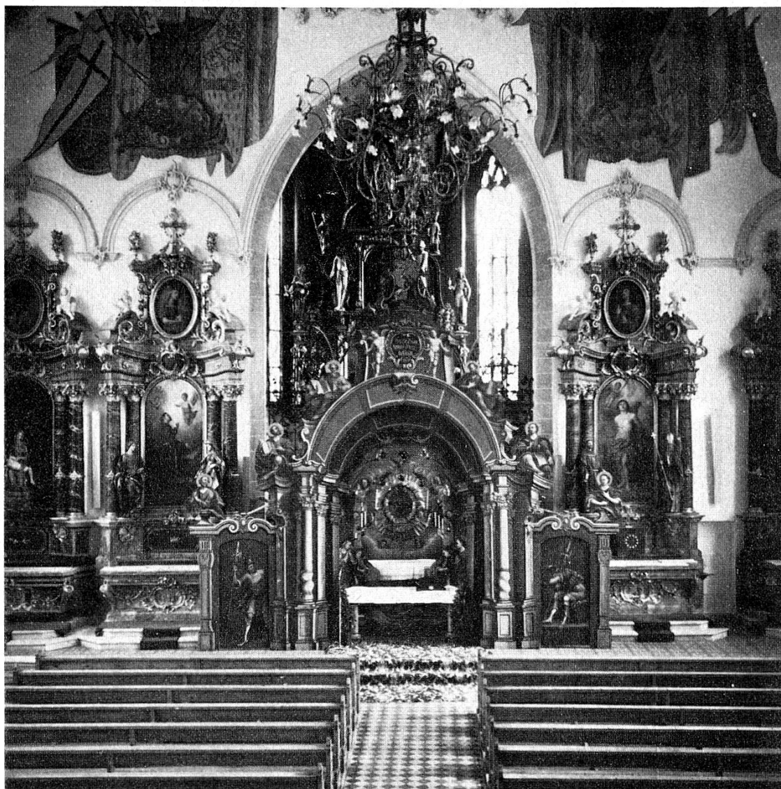
Heiliggrab in der Pfarrkirche Appenzell

dieses Abends verstummt die Orgel und schweigen die Glocken bis zur Auferstehung. Nun sind vom Turm die ›Rätschen‹ zu hören, und die Ministranten bedienen sich hölzerner Klappern statt der Schellen. Nach dem feierlichen Gottesdienst werden in der Stefanskapelle der Pfarrkirche und in den Landpfarreien Anbetungsstunden gehalten bis Mitternacht.