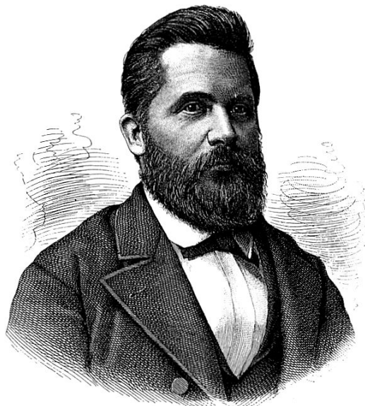
Johann Baptist Emil Rusch (1844–1890)