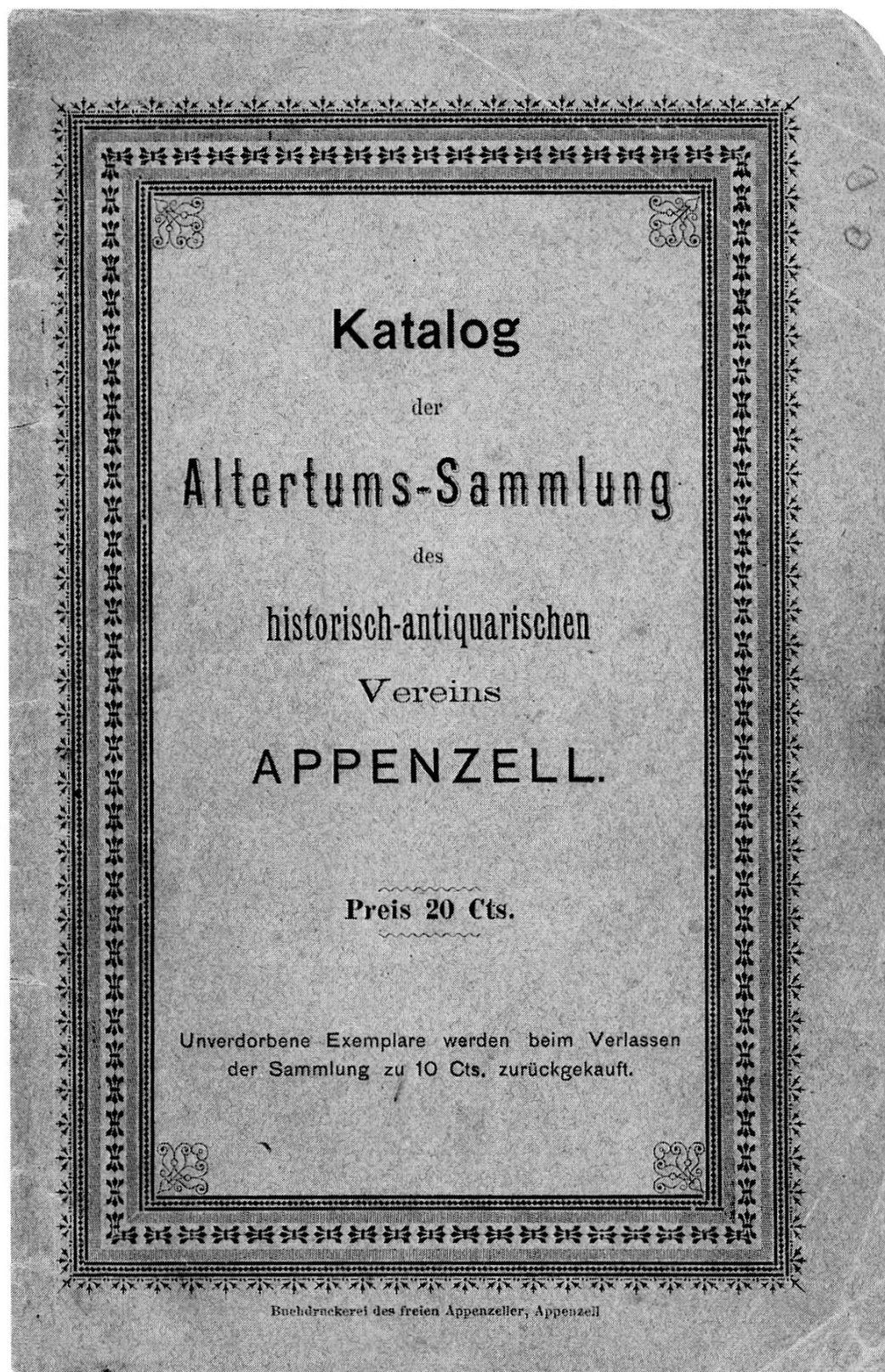
Titelblatt zum Führer zur Altertumssammlung im Schloss, herausgegeben im Jahre 1892.