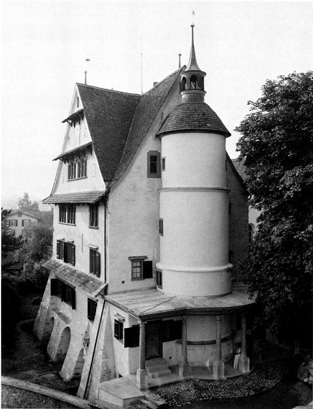
Das Schloss, in welchem von 1886 bis 1965 das Museum untergebracht war.

Bereits in den ersten Jahren ihres Bestehens verzeichnete die Altertumsammlung eine ständige Zunahme der Besucher. Während der Sommermonate des Jahres 1880 besuchten 250 Personen die Sammlung und brachten Billetteinnahmen von Fr. 99.—. Demgegenüber ergaben im Jahre 1890 die Eintritte bei 760 Besuchern den Betrag von Fr. 323.10. Bis zur Jahrhun-