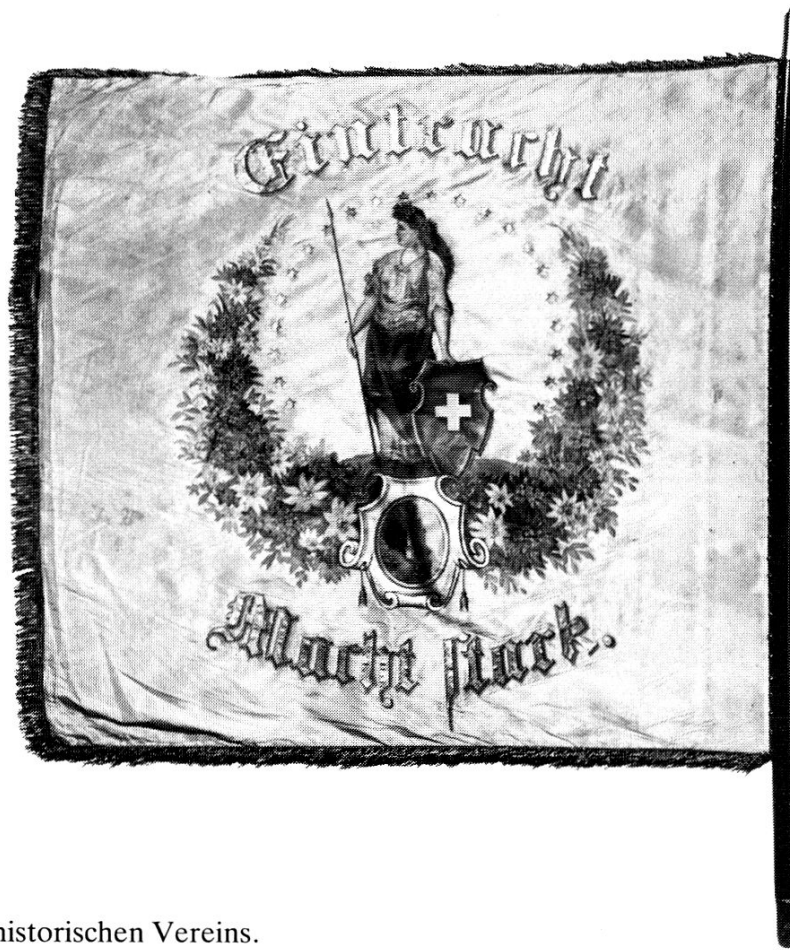
Fahne des Jungen historischen Vereins.