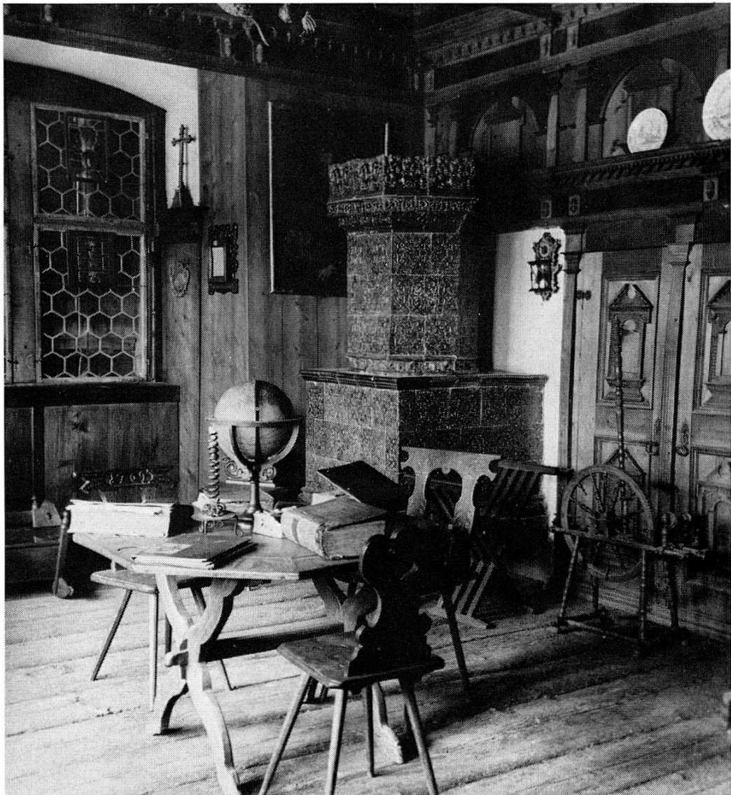
Die vielbewunderte Stube in der Altertumssammlung im Schloss bis 1966.