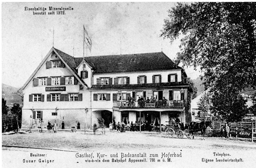
Hoferbad zur Zeit von Oskar Geiger.

der Zeit die Geschichtsvorträge intensiver und widmete sich anspruchsvollen Themen der engeren Heimatgeschichte. Verschiedene Arbeiten stießen auf besonderes Interesse: «Die Feste Clanx» (1885), «Die Einkünfte der Abtei St.Gallen» (1886), «Etymologie appenzellischer Ortsnamen» (1899) usw. Dabei betrieb er gelegentlich auch gründliches Quellenstudium. Einige Vorträge überarbeitete er mehrmals und liess sie später im Druck erscheinen.