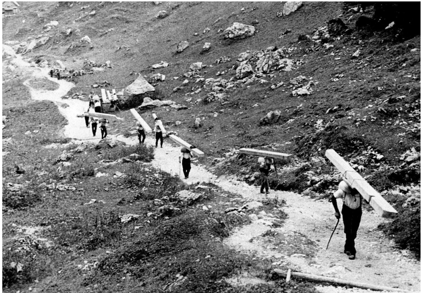
Die Träger setzen ihren Anstieg im Brülltobel fort.

te er von Fählen nach Schwendi. Damit keine Streue auf dem weiten Weg verloren ging, hat man die Burdenen wohlgeformt und allseitig «gschoppet». Der betagte, noch rüstige Mann erzählte mir mit erstaunlichem Gedächtnis seine Jugenderinnerungen: «Es gab jeweils gut zu essen und im Wagenschopf wurde Handorgelmusik gemacht. Mehr als zwei Stücke konnte der Musikant nicht spielen, und dennoch habe man es recht lustig gehabt.»