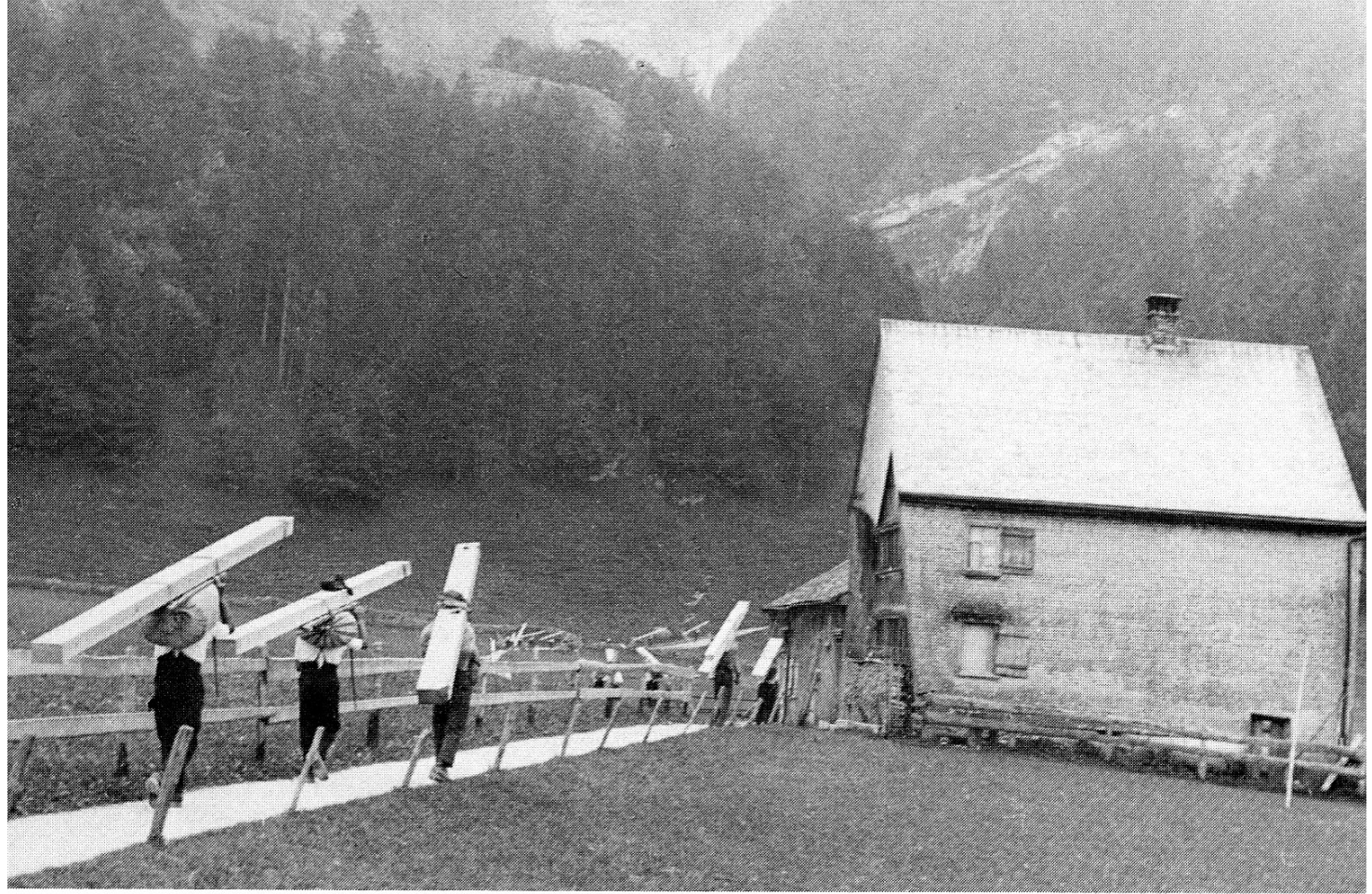
Die «wandernde Kapelle» zieht an der letzten Brülisauer Liegenschaft vorbei zum Brülltobel.

Tanzes. Der Veranstalter der «Trägi» hat für Speis und Trank und die Spielmannen zu sorgen, die auflüpfige Musik machen: