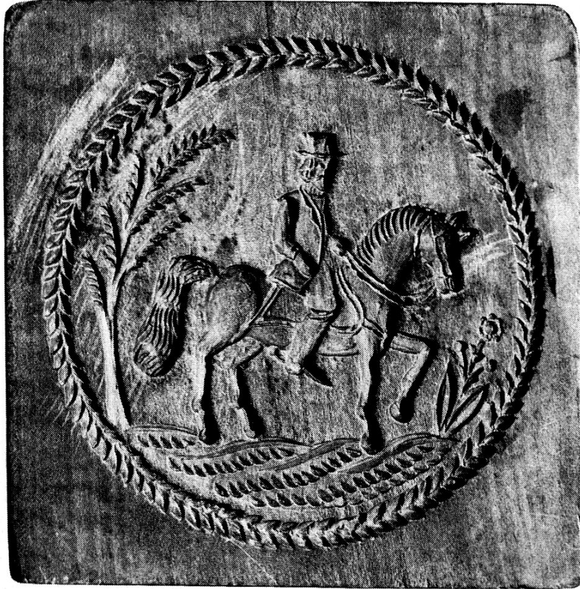
Reitersmann zu Pferd

aber auch als Ornament dem Reichsadler. Erste Erwähnungen des verzierten Appenzeller Bibers fand ich aktenmässig im 16. Jahrhundert. In einem Mandat von 1597 verbot die Obrigkeit von Appenzell Innerrhoden Spiele aller Art, vor allem auch das «piperzelten abschlahen» 5 ). Es muss sich dabei um ein Spiel von Kindern gehandelt haben,