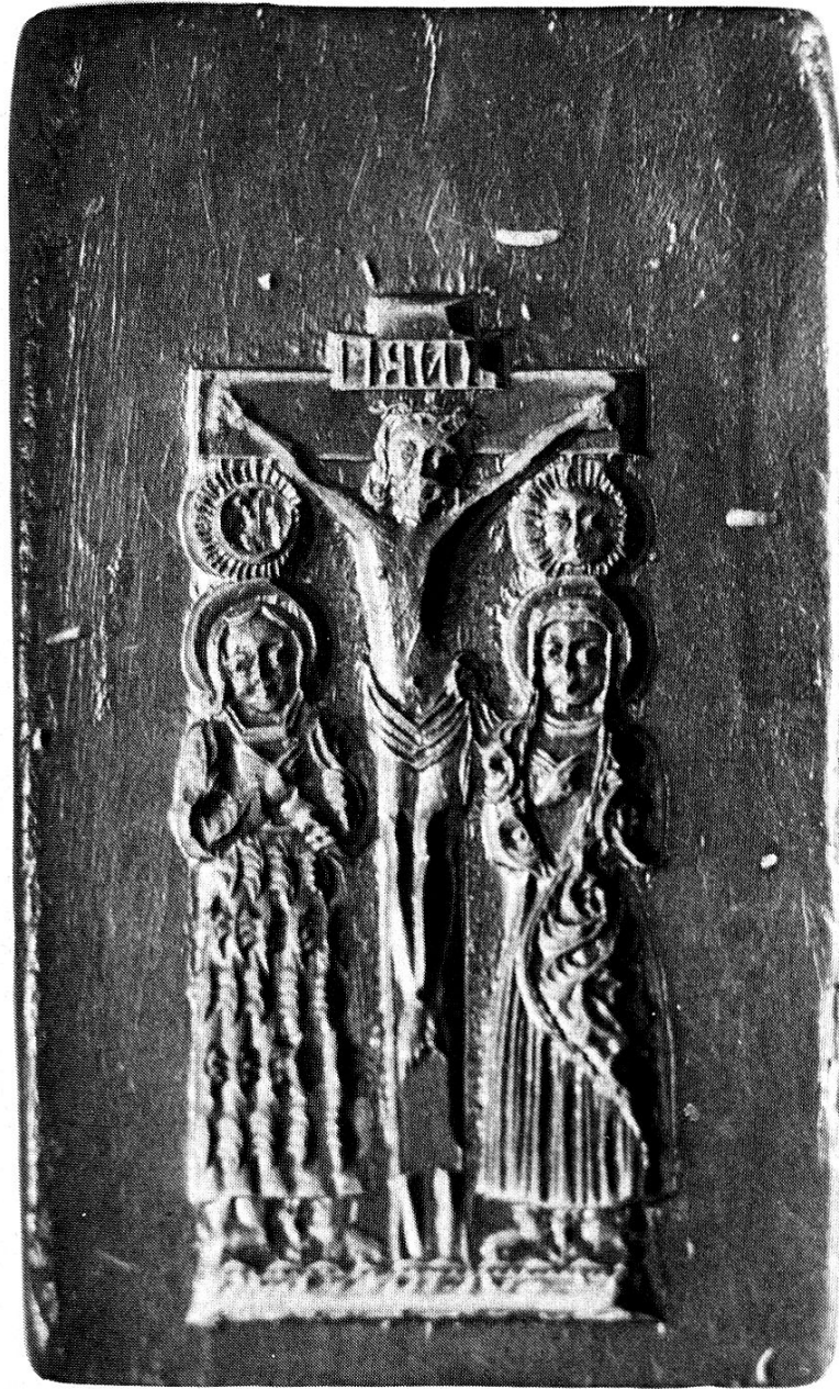
Christus am Kreuz mit Maria, Johannes, Sonne und Mond rückseitig das Ulrichskreuz, Ende des 17. Jahrhun- derts, Holz 9.9 x16.5 cm, sehr frühes Stück vermutlich süddeutsch, Privatbesitz St.Gallen

teste bekannte Bibermodell im schweizerischen Landesmuseum in Zü- rich. Er trägt die Jahrzahl 1461 und stammt ausgerechnet aus dem Do- minikanerinnenkloster St.Katharina im st.gallischen Wil. Die Mu- seumsleitung datiert ihn sogar auf Ende des 14. Jahrhunderts 3 ). All'