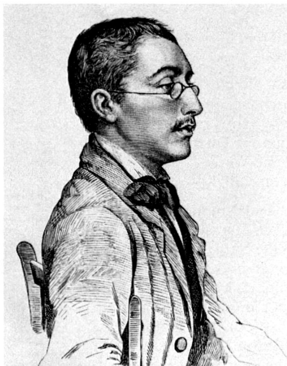
Scheffel's Jugendporträt Nach einer Zeichnung aus dem Jahre 1853

Als «landfahriges Herz, in Stürmen geprüft» ist Scheffel 1854 das erstemal zum Äscher und Wildkirchlein hinaufgestiegen. Ein aufwühlendes Erlebnis hat ihn aus der Menschengemeinschaft fortgejagt, und in schmerzhafter Ergebung überlässt er seine Seele der tröstenden Bergeinsamkeit: