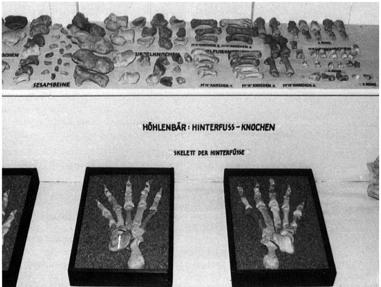
Ausschnitt aus der Wildkirchlisammlung.