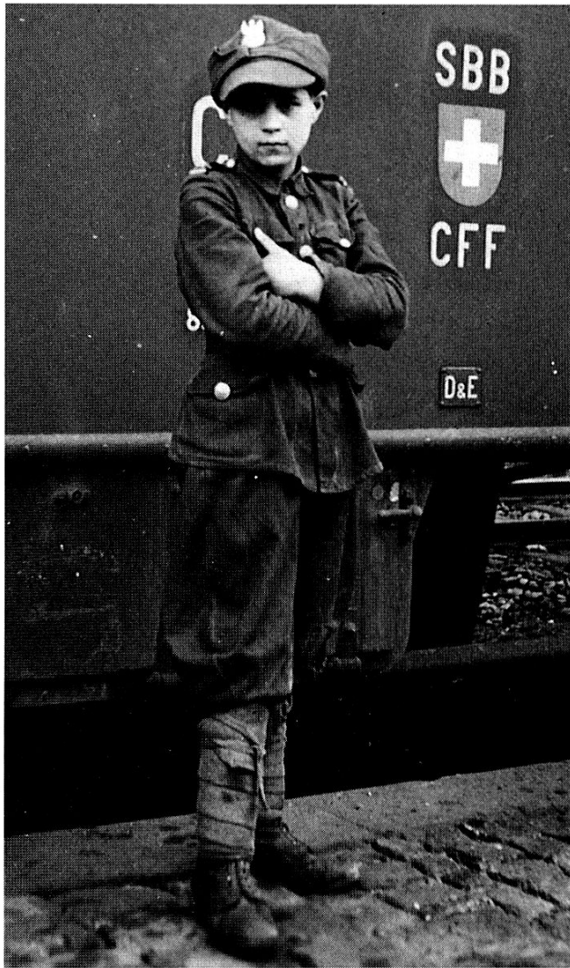
Vierzehnjähriger polnischer Korporal

grössere Möbelstücke in offenen Wagen transportiert wurden. Die Bevölkerung war der Meinung, dass alles Material von den russischen Soldaten gestohlen worden sei und nach Russland transportiert werde. Im weitem kam auch ein polnischer Personenzug, bei dem die Mitfahrenden zum Teil auf den Treppen oder sogar auf dem Wagendach sassen. Nach einem Aufenthalt von einer Stunde fuhr unser Zug etwa einen Kilometer ausserhalb des Bahnhofes auf ein Stumpengeleise, von dem aus rechts ein Maschinenraum für ca. 35 Lokomotiven stand und wo es Tag und Nacht pfiff, schnupfte und viel Rauch entwickelte, dass es fast nicht zum Aushalten war, zudem war die Reinlichkeit sehr schlecht. Kaum dort angelangt, kamen schon zweihundert Schweizer-Auswanderer an, die nach der Schweiz mitgenommen werden wollten. Die Leute waren in einem traurigen Zustand, schmutzig, ausgehungert, sehr schlecht gekleidet, zum Teil krank und voll von Läusen und Wanzen. Sofort mussten wir an die Arbeit, sie desinfizieren, verladen, mit Suppe verpflegen und ihnen Käse und Kartoffeln verabreichen. Vor Freude gab es Tränen, als wir ihnen ein so gutes Abendessen servierten.