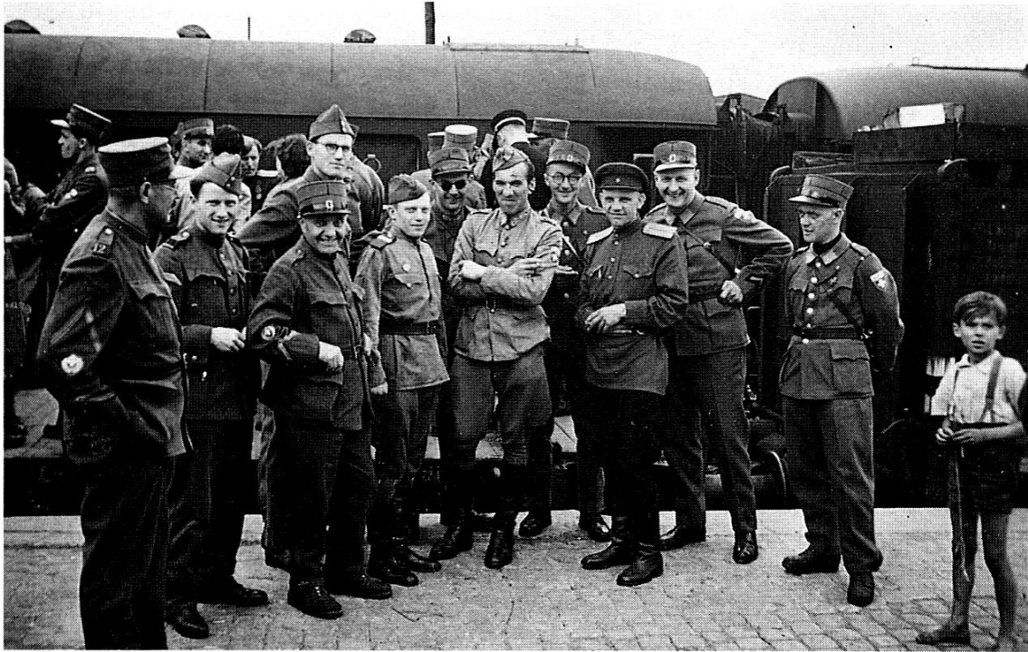
Schweizerische und Russische Soldaten in Kattowitz