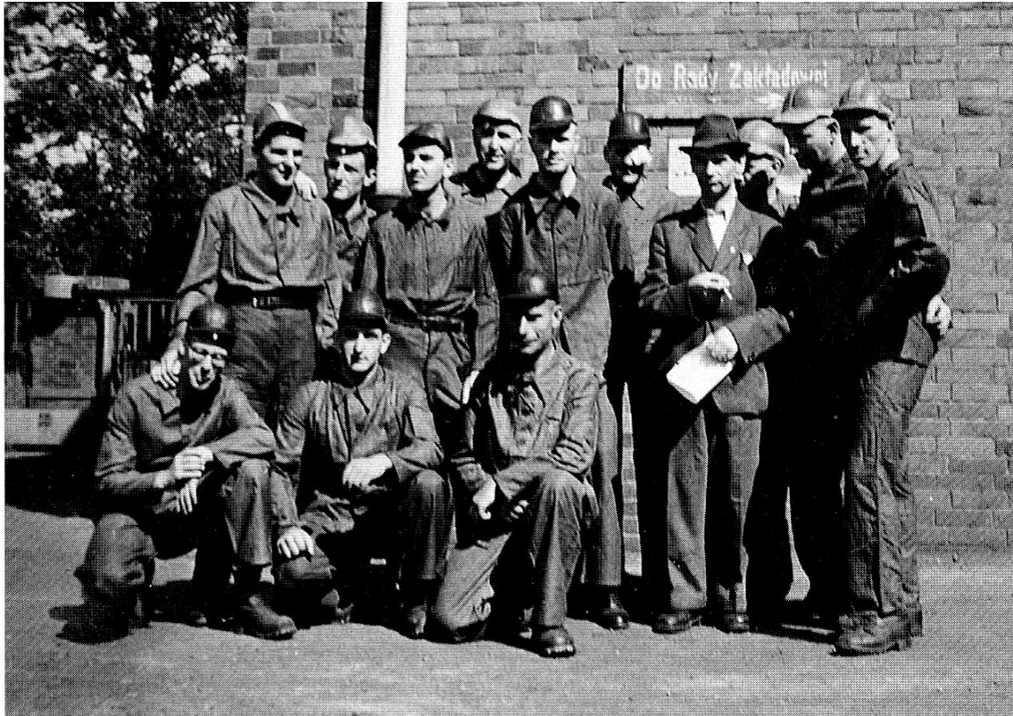
Schweizer Soldaten in Kleidern der Kohlengruben-Arbeiter

Ein Vorarbeiter wurde unser Begleiter; wir beschenkten ihn mit Zigaretten. Dann führte er alle in einen Liftraum und lud uns ein, den Lift, der eine Tragkraft von 20 Tonnen hat, zu besteigen. Dieser Lift fördert täglich 8000 Tonnen Kohle zu Tage. Als wir eingestiegen waren, wurde die Türe geschlossen und es ging wie der Teufel in das Loch hinunter, so dass das schwache Geschlecht schrie. 50 Sekunden später sind wir schon 510 m tief unter der Erdoberfläche. Vor uns stand eine kleine elektrische Lokomotive mit zwanzig leeren Kohlenwagen, in denen je drei Personen Platz nehmen mussten. Wir wurden zirka 1\frac{1}{2} bis 2 km weit gefahren und von dort ging es zu Fuss weiter. Je weiter wir vorwärts gingen, desto niedriger wurde der Tunnel. Nach einem Marsch von einer halben Stunde kamen wir endlich zum Ende des Stollens. Hier wurde mit einem Kompressor die Kohle weggebrochen, der Stollen war ungefähr einen Meter hoch, so dass alle Arbeiter auf den Knien schaffen mussten, eine fürchterliche Arbeit, ein fürchterlicher Kohlenstaub und eine Temperatur von 38—45 Grad Wärme. Die Kohle wird auf einem Einmeter breiten Gummiband nach vorn befördert. Die Arbeiter sind zum grössten Teil deutsche Kriegsgefangene, deren Tagesration betrug ein halber Teller Suppe und \frac{1}{4} kg