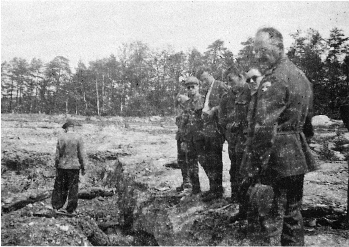
Auschwitz, Leichengruben im KZ-Lager