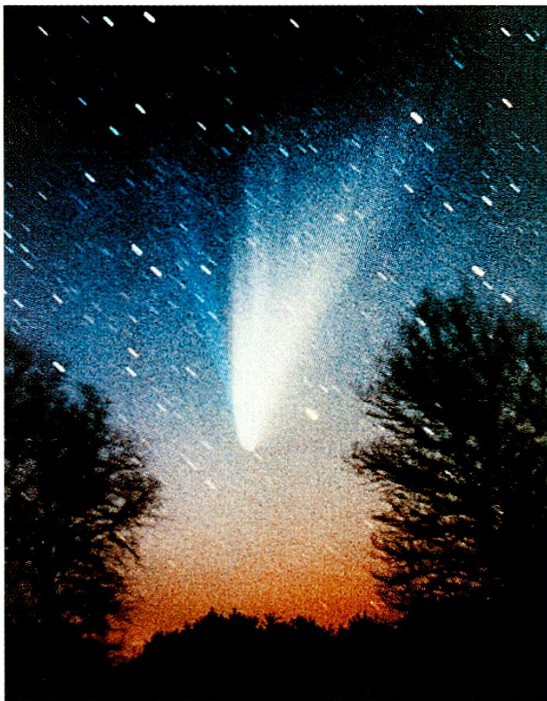
Der halleysche Komet hat eine Umlaufzeit von 76,3 Jahren, bekannt nach dem Entdecker, dem britischen Astronom Edward Halley (1656–1747).