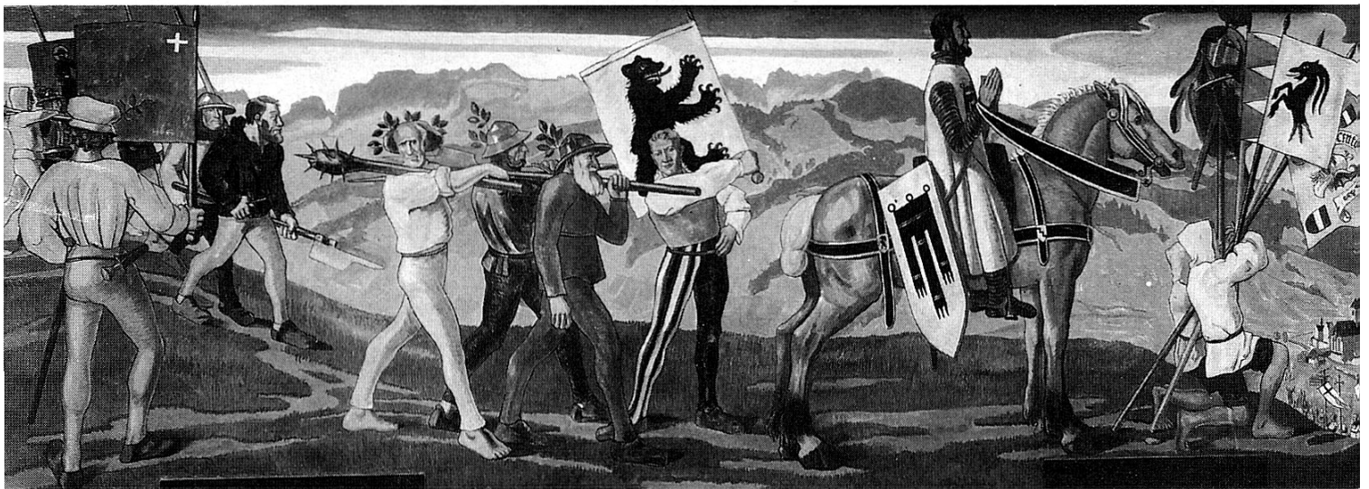
Rückkehr von der Schlacht am Stoss. Rechts aussen Bannerträger, der sogar das Banner der «Cento diavoli» trägt, obwohl es erst ein Jahr später erobert wurde. Fresko auf der Südseite des Rathauses von Appenzell von August Schmid (1928).

Stadtbanner von Feldkirch , um 1400, Leinwandkopie 1648, 147 x 150 cm. Angenähter Schwenkel. Auf weissem Grund dreilappige schwarze Kirchenfahne, erobert am Stoss 1405 82 .