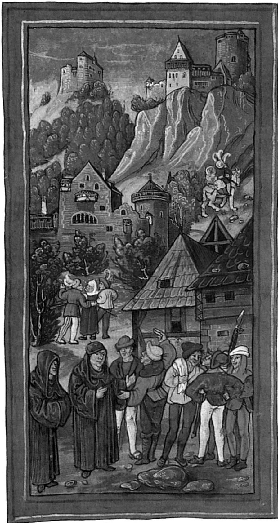
Aufstand der Appenzeller. Miniatur aus der Luzerner Bilder-Chronik des Diebold Schilling (Zentralbibliothek Luzern)