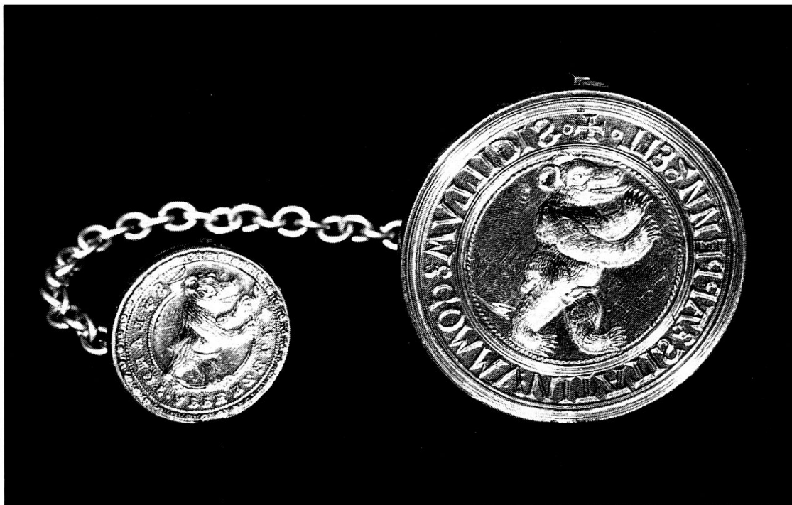
Das Landessigill aus den Jahren 1518 und 1530, das noch heute an der Landsgemeinde gebraucht wird. Inv. Nr. 3820

heitliches Schwert benutzt wird, sind es in beiden Appenzell deren zwei. Symmetriegründe können diese Verdoppelung nicht erklären. Vielmehr ist anzunehmen, dass damit die beiden Staatswesen, die sechs inneren und die sechs äusseren Rhoden bzw. deren separate Hoheit an der gemeinsamen Landsgemeinde vorgezeigt werden sollte. Diese Erklärung dürfte zutreffen, findet sich der atypische Brauch in beiden Appenzell doch schon vor der Landteilung. Sonst hätte er sich nicht in beiden Appenzell erhalten können. Vor 1597 waren die inneren und äusseren Rhoden gewissermassen ein Zweckverband, gab es doch drei Gemeinden, separate für die äusseren Rhoden, eine weitere für die inneren Rhoden resp. die Kirchhöri Appenzell und zudem noch die gemeinsame, die Landsgemeinde. 64