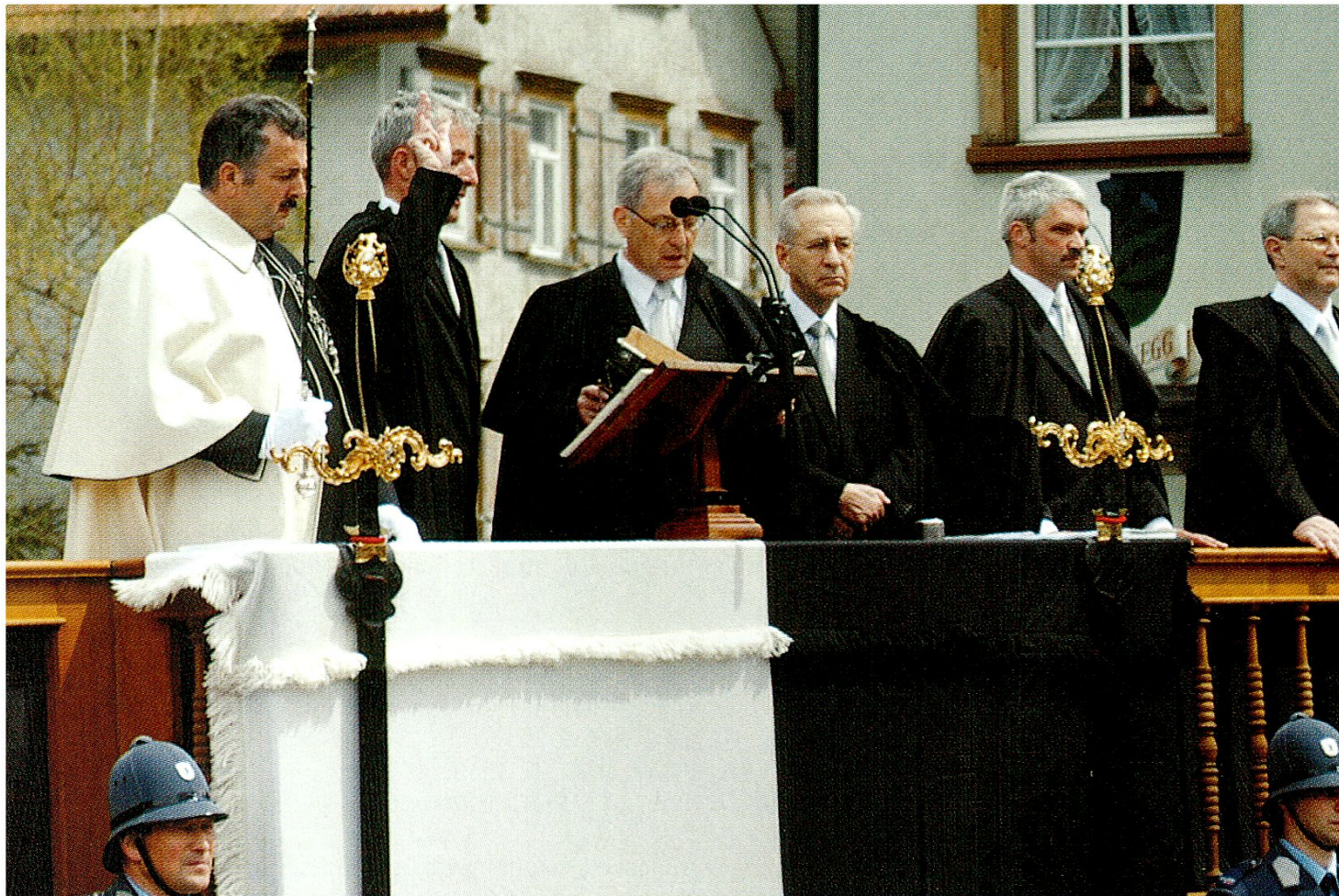
Vereidigung des regierenden Landammanns (2003).

Der Eid, wie er an der Landsgemeinde gesprochen und beschworen wird, ist erstmals im Landbuch, dessen Hauptteile im Jahre 1409 angelegt wurden, nachgewiesen. Er befindet sich am Anfang des Landbuches, das in diesem Jahre angelegt wurde. 53 Gerne wüssten wir, woher dessen Formulierung stammt. Die politischen Eide wurden schon mehrfach untersucht. In der Regel wird festgestellt, dass der Appenzeller Eid einer der ältesten sei und in dieser Form sich vorher nicht nachweisen lasse. 54 Er wurde ins 1585 neu geschaffene Landbuch übernommen, 1920 gekürzt und teils sprachlich neu gefasst, weil der Text aus dem 15.