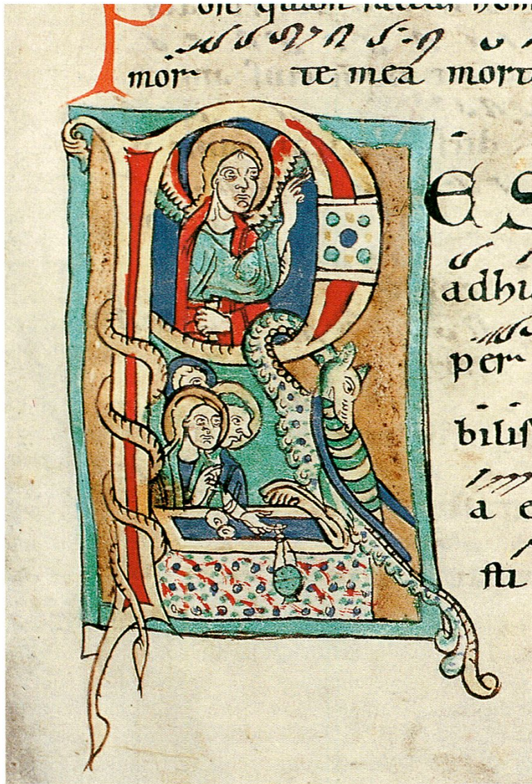
Initiale «R» im Graduale zum Osterfest: Resurrexi et adhuc tecum sum. Alleluia (dt.: «Ich bin erstanden und bleibe bei dir. Halleluja.»).

Jahrhundert hinweisen. Abt Wilhelm von Hirsau (1069-1091), der seine Reform im Zeitalter des Investiturstreites begann, kam aus St. Emmeram in Regensburg, leitete in den Jahren von 1080-1082 das Allerheiligenkloster in Schaffhausen und übernahm dann das Kloster Hirsau, von dem im 11. und 12. Jahrhundert die Reform bis nach Bayern, Österreich und Italien ausstrahlte. Diese Klosterreform spiegelt sich auch in der Liturgie, die ihrerseits über die «Libri ordinarii», aber auch in den Sakramentaren und Missalien des späten 11. und des 12. Jahrhunderts nachweisbar wird. Das Appenzeller Missale gehört textgeschichtlich diesem Hirsauer Kreis an, dessen bedeutendste Klöster neben Hirsau Weingarten und Zwiefalten waren.