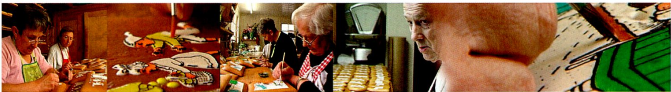
Videostill zum Chlausebicklimalen aus dem Film von Thomas Karrer.

Öffentliche Führungen durch die Ausstellung.