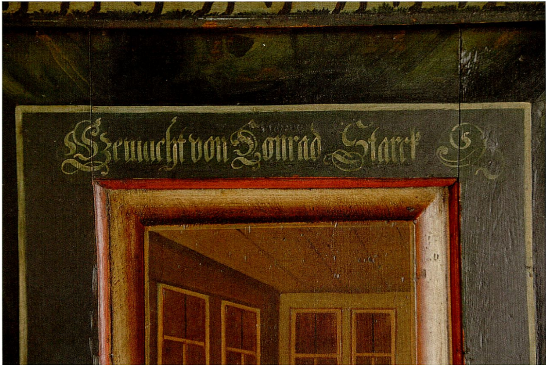
«Gemacht von Conrad Starck. 1809.». Ausschnitt aus dem einzigen signierten Schrank von Conrad Starck, welcher im Museum Im Blauen Haus zu sehen ist.

Die Erfahrung lehrt, dass die für Bauern tätigen Handwerker im engen Umkreis ihres Wohnorts arbeiteten. Das Augenmerk bei der Suche nach Werken von Starck galt deshalb Malereien, die aus Appenzell Innerrhoden stammen und stilistisch mit dem Kasten, auf den Conrad Starck seinen Namen schrieb, in Einklang zu bringen sind. Dabei zeigte sich, dass zahlreiche Möbel aus dem ausserrhodischen Kantonsteil, die bisher Conrad Starck zugeschrieben wurden, andere Merkmale aufweisen. Ihre Bemalungen gehen präziser auf den Natureindruck ein. Damit nähern sie sich der Ausdrucksweise akademisch ausgebildeter Maler, die für das städtische Bürgertum tätig waren. Conrad Starck behielt seine bäurische Ursprünglichkeit, wie die Ausstellung eindrücklich erkennen liess.