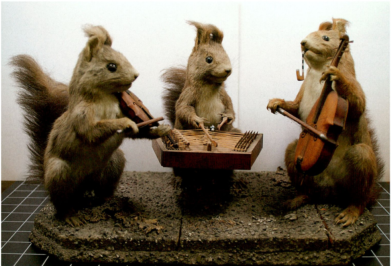
Eichhörnchen Streichmusik (heute als Leihgabe im Zentrum für Appenzellische Volksmusik im Roothuus Gonten).