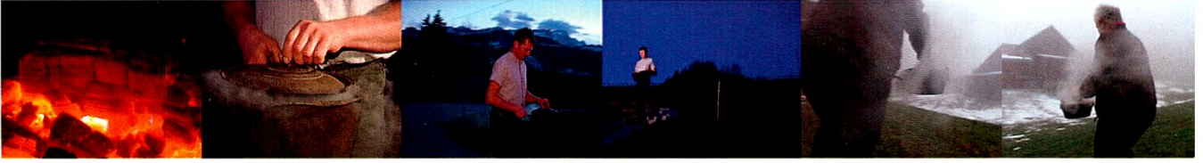
Videostill zum Räuchle aus dem Film von Thomas Karrer.