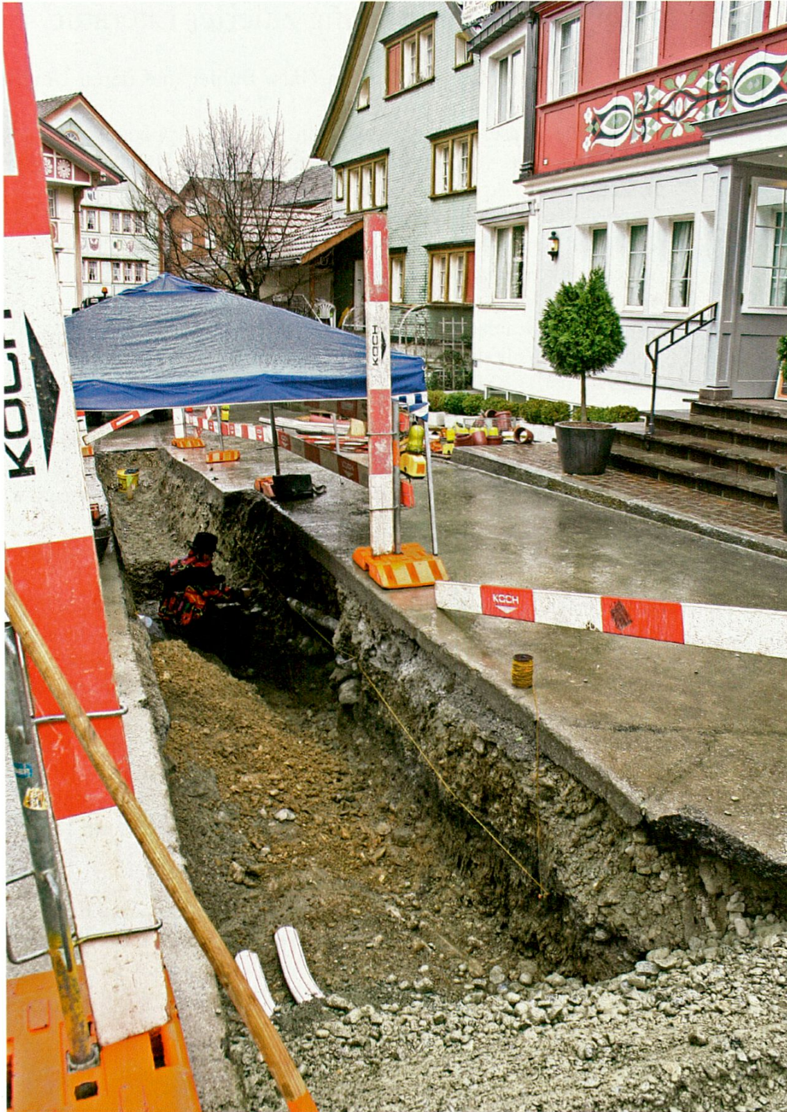
Appenzell, Sternenplatz vor dem Café «Drei Könige»: Blick in die Frühzeit des alten Hauptortes: Die mittelalterliche Kulturschicht (dunkles Band) enthält Keramikscherben aus dem 13. Jahrhundert und grosse Mengen Eisenschlacken.