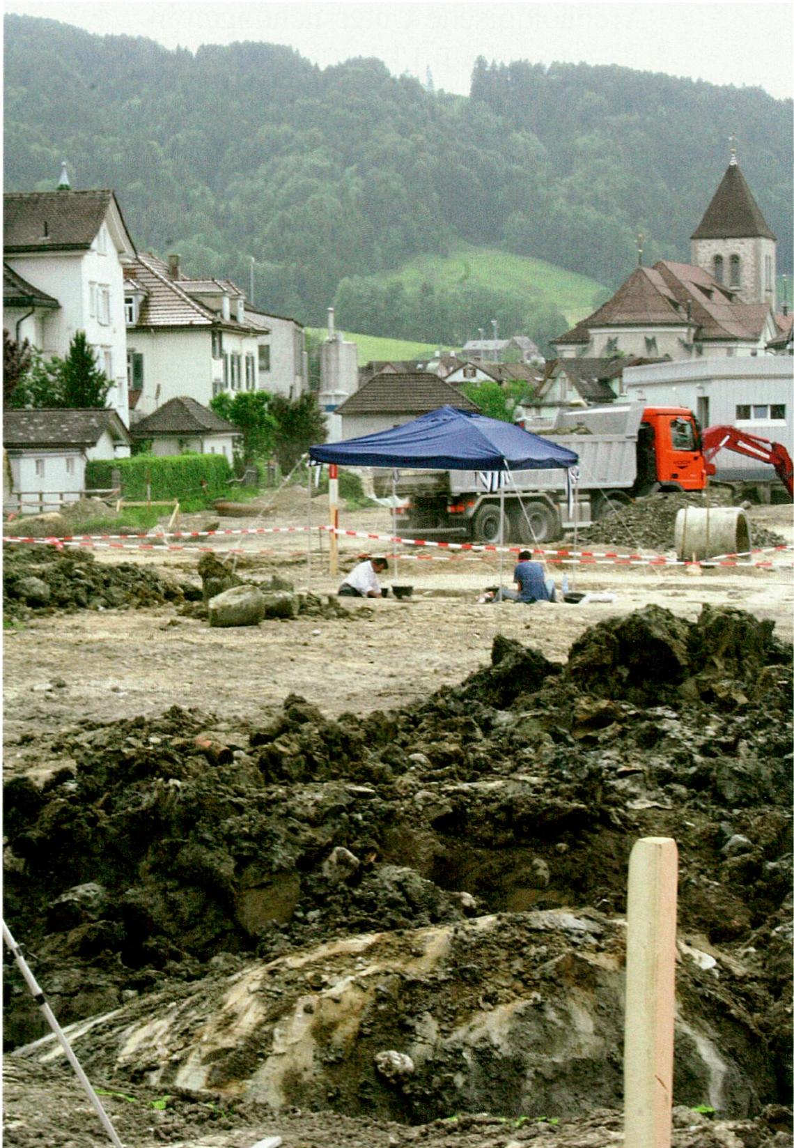
Appenzell, Blumenrain: Überbauung «Betreutes Wohnen». Ausgrabungen an einem Rastplatz aus der mittleren Steinzeit um 8000 v. Chr.