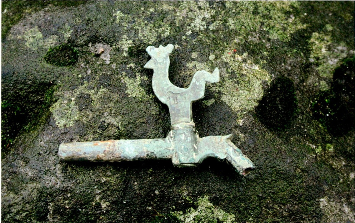
Appenzell, aus einem Leitungsraben südlich des Hotels «Krone»: Weingenuss im alten Appenzell! Zapfhahn aus Bronze, ca. 16. Jahrhundert.