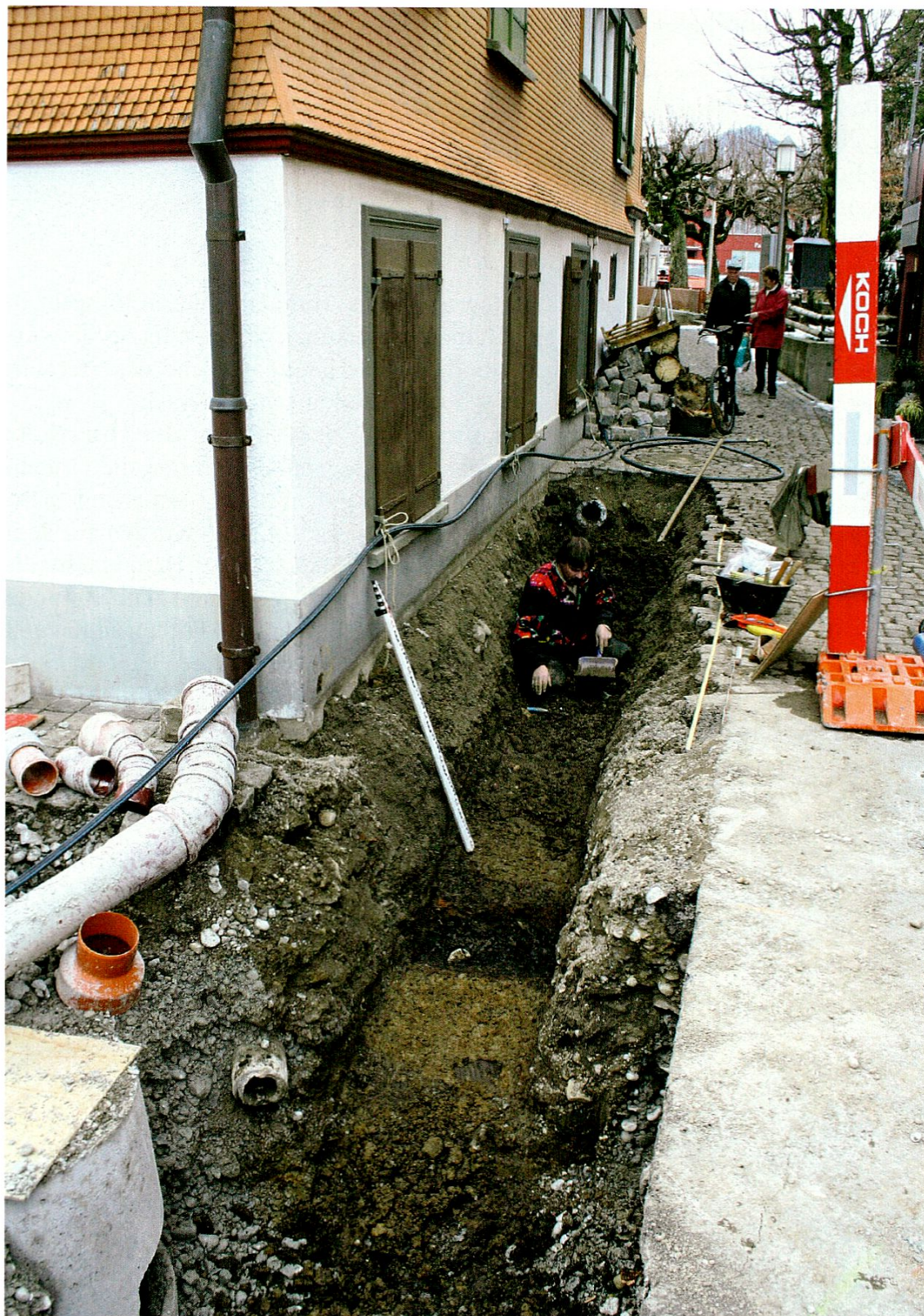
Appenzell, Leitungsgraben auf dem Sternenplatz hinter dem Restaurant «Sternen»: Spuren von Gewerbe oder eines Dorfbrandes? Graben mit rot verziegelten Seitenwänden und aufgefüllt mit Holzkohle. Spätmittelalter/Frühe Neuzeit.