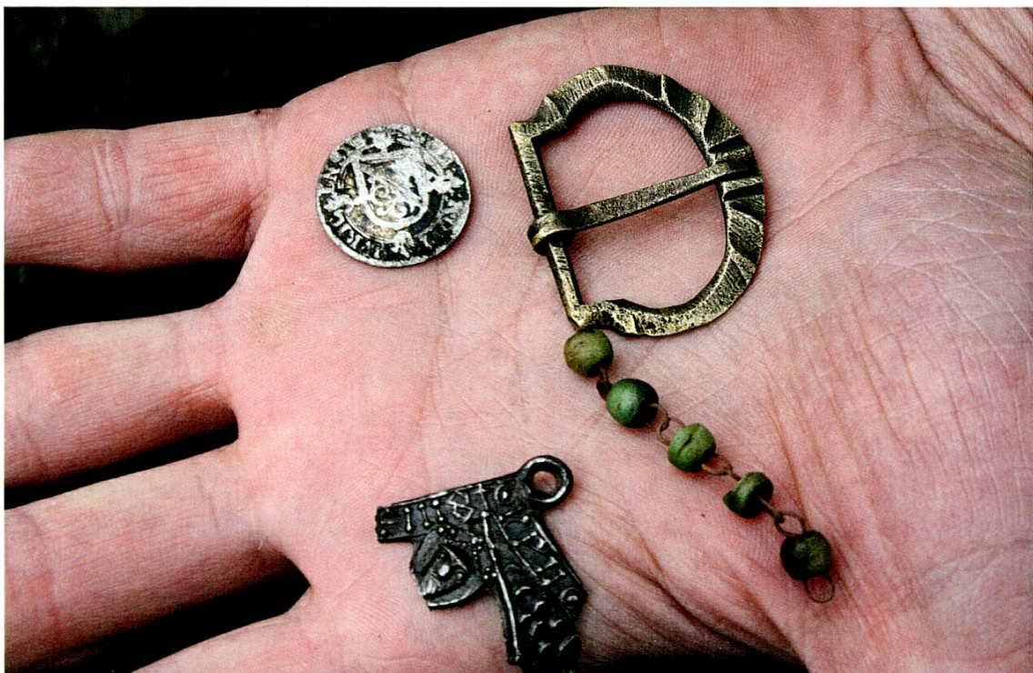
Appenzell, Postplatz: Funde beim Neubau der Trafostation aus der Zeit zwischen dem 15. und 18. Jahrhundert: Schnalle aus Bronze, Pilgerabzeichen aus Einsiedeln, Rosenkranz, Zürcher Schilling.